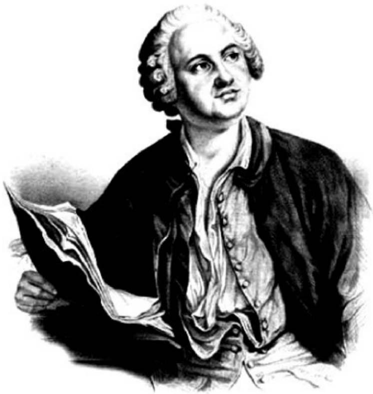
Илл. 2. М.В. Ломоносов