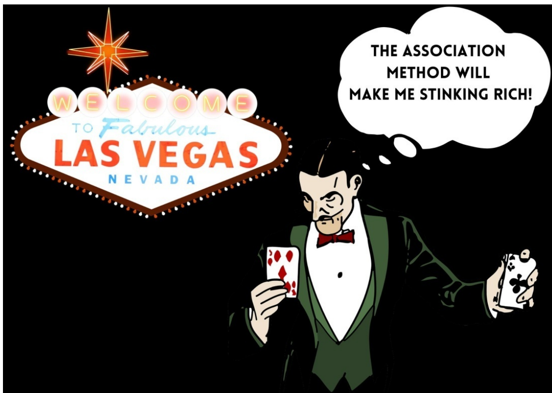
Рис. 3 – Метод ассоциаций сделает меня очень богатым!

Сегодня метод ассоциаций является самым эффективным способом усвоения ЛЮБОЙ информации. Для примера, если вы были в Лас-Вегасе, то наверняка видели уличных фокусников, которые могут взглянуть на 10 банкнот в течение 60 секунд и запомнить все буквы и цифры. А это около 100 символов! Как это возможно? Они используют метод ассоциаций. Конечно, они запоминают цифры на короткий срок, но если использовать ассоциации с методом «интервального повторения» , то можно запомнить любую информацию навсегда, при условии, что будете всё время повторять её через определенные интервалы.