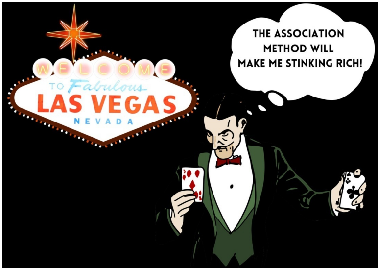
Рис. 3 – Метод ассоциаций сделает меня очень богатым!