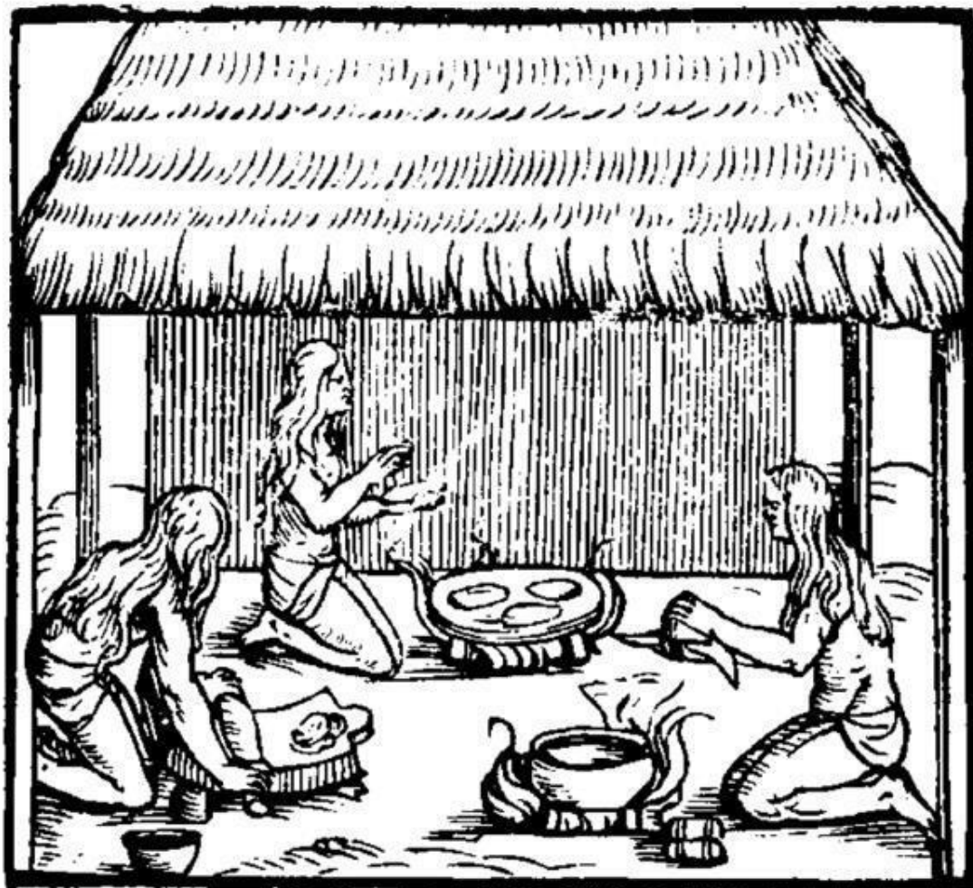
Иллюстрация из Historia del Mondo Nuovo Джироламо Бенцони. Женщины племени таино готовят лепешки из маниока. 1565

Последние были оттеснены на запад острова таино. Плюс стали выделять еще и жителей средней части острова, которых называли сибонеи (siboney) и часто путали с гуакахатабеи, так как они тоже враждовали с таино.