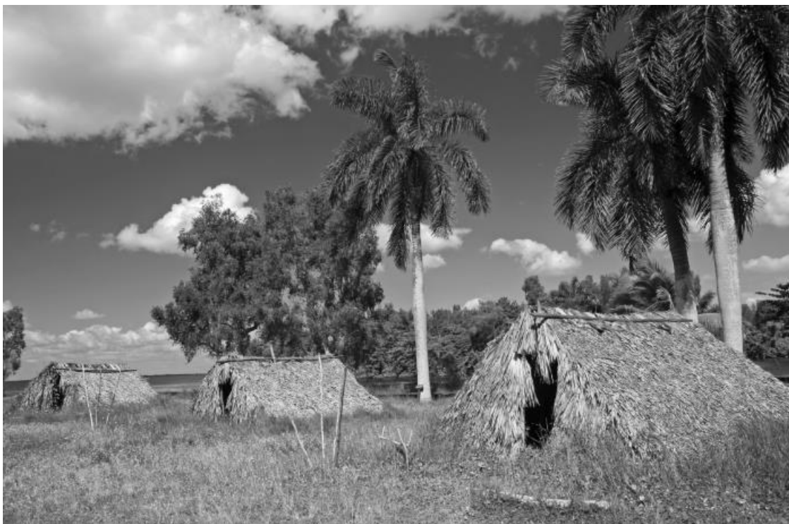
Реконструкция деревни племени таино на полуострове Санато, Куба

Таино не были людоедами, в отличие от других народов этого региона.