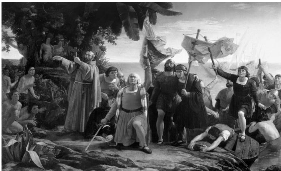
Диоскоро Пуэбла. Высадка Колумба в Америке. 1862

Местные аборигены первоначально воспринимали пришельцев как богов, спустившихся с голубого неба на землю. А Христофор Колумб, вынув меч, торжественно принял остров во владение испанских монархов. Острову он дал имя Сан-Сальвадор, что значит Святой Спаситель.