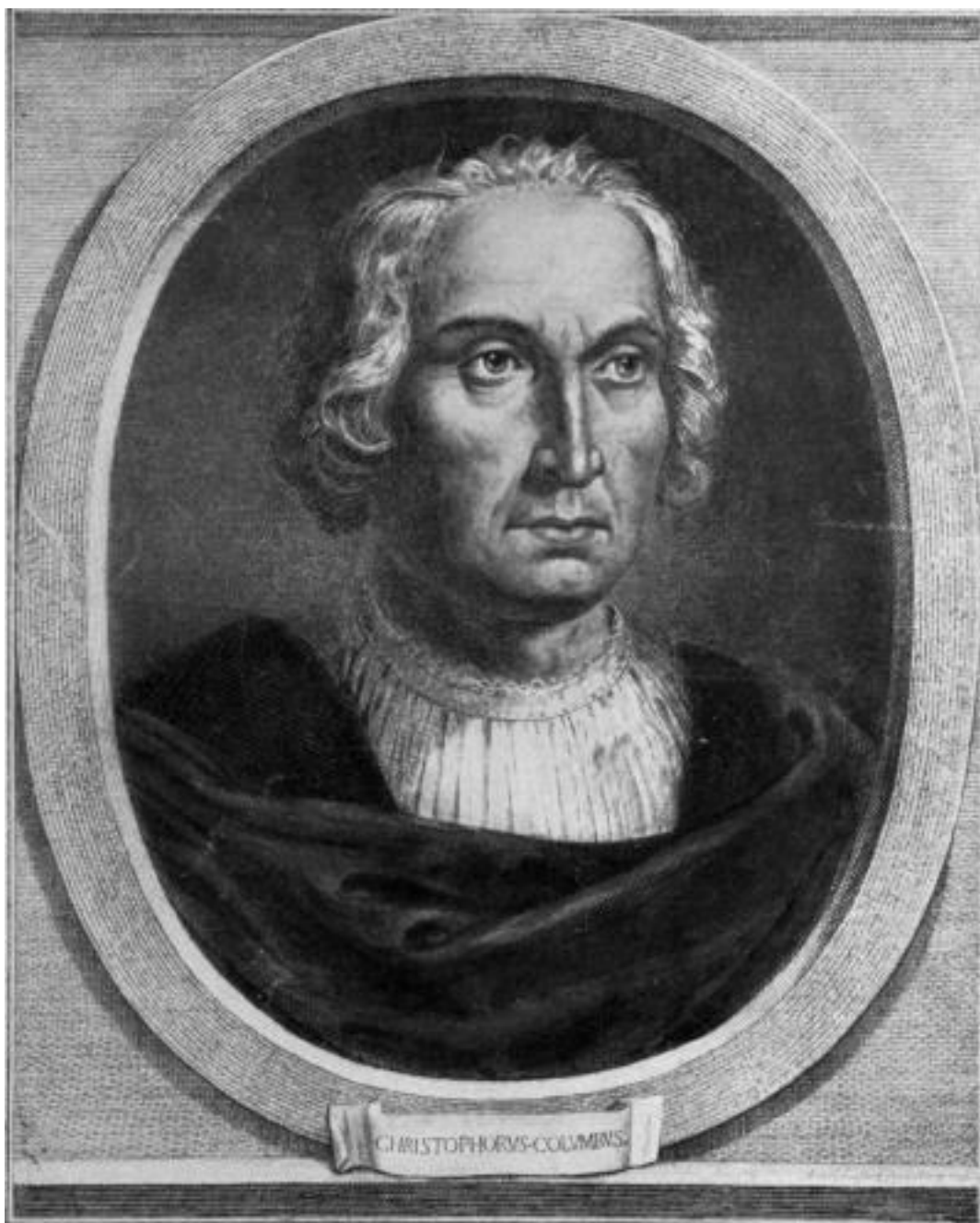
Алибрандо Каприоли. Христофор Колумб. Конец XVI века

Итак, считается, что Куба была открыта 28 октября 1492 года, когда к острову подошли корабли первой экспедиции генуэзца на испанской службе Христофора Колумба (тогда корабли прошли вдоль северо-восточного побережья острова).