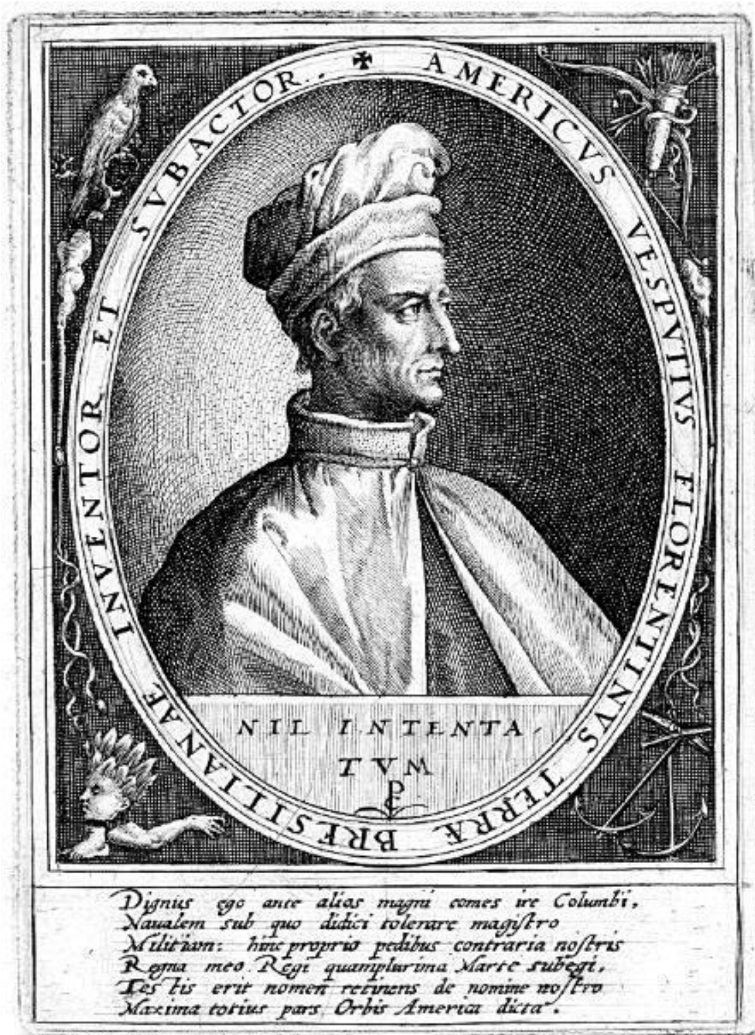
Криспейн ван де Пасс Старший. Америго Веспуччи. Начало XVII века

В 1508 году губернатор Николас де Овандо-и-Касерес для исследования островов Куба и Эспаньола (Гаити) организовал две экспедиции. Начальником кубинской он назначил упомянутого выше Себастьяна де Окампо, руководителем гаитянской – опытного навигатора Андреса Моралеса.