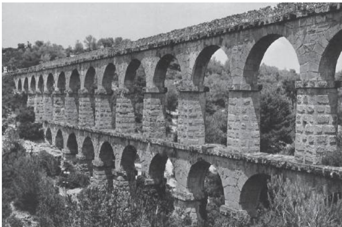
Акведук Лас Феррерас близ Таррагоны. I век

скую архитектуру модной курортной зоны, то ландшафт, сравнительно пустынный, вольный, открытый небу и широкому морскому простору, предстанет таким же, каким он был, когда по Виа Августа шествовали римские легионеры, спешили торговцы и горожане, проезжали в повозках крестьяне. Так же как тысячелетия назад в северо-восточной части моря вставал огненный диск солнца, клубились на горизонте темно-синие облака, как и в древности, мелели каменистые реки, к которым подводили многочисленные дороги.