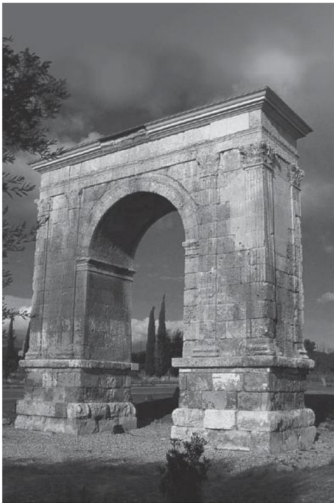
Триумфальная арка в Бара близ Таррагоны. 107 год