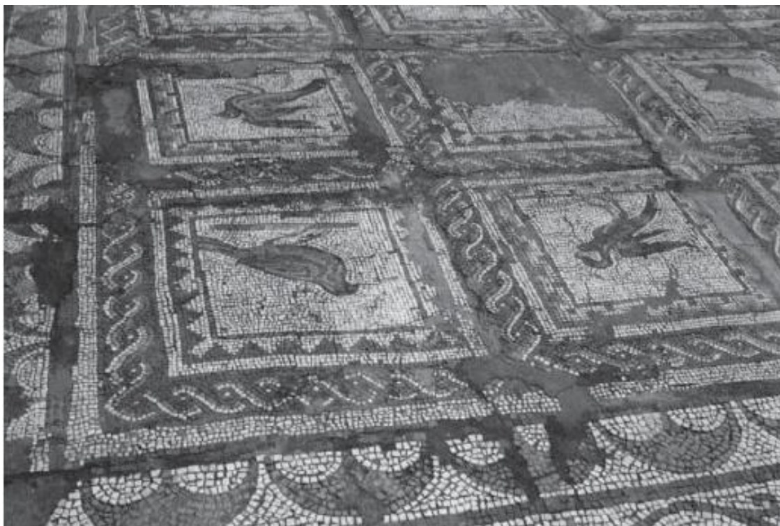
Мозаика пола в Италике (близ Севильи)

Искусство мозаики в римское время развивалось на основе греко-эллинистической традиции, плотно скрепленной классическими нормами, иконографическими и художественными канонами. Придерживаясь исходных изобразительных прототипов, мастера провинций обращались с ними достаточно вольно, вносили в них живые и свежие черты. Изображались мифологические и литературные сюжеты, триумфы морских божеств, шествие бога Диониса, покровителя растительности и виноделия, в окружении вакхической свиты, аллегории времен года, рыбы, птицы, растения, фрукты и сцены реальной жизни – охота и рыбная ловля, сбор урожая, конные состязания в цирке, игры в амфитеатрах, театральные представления.