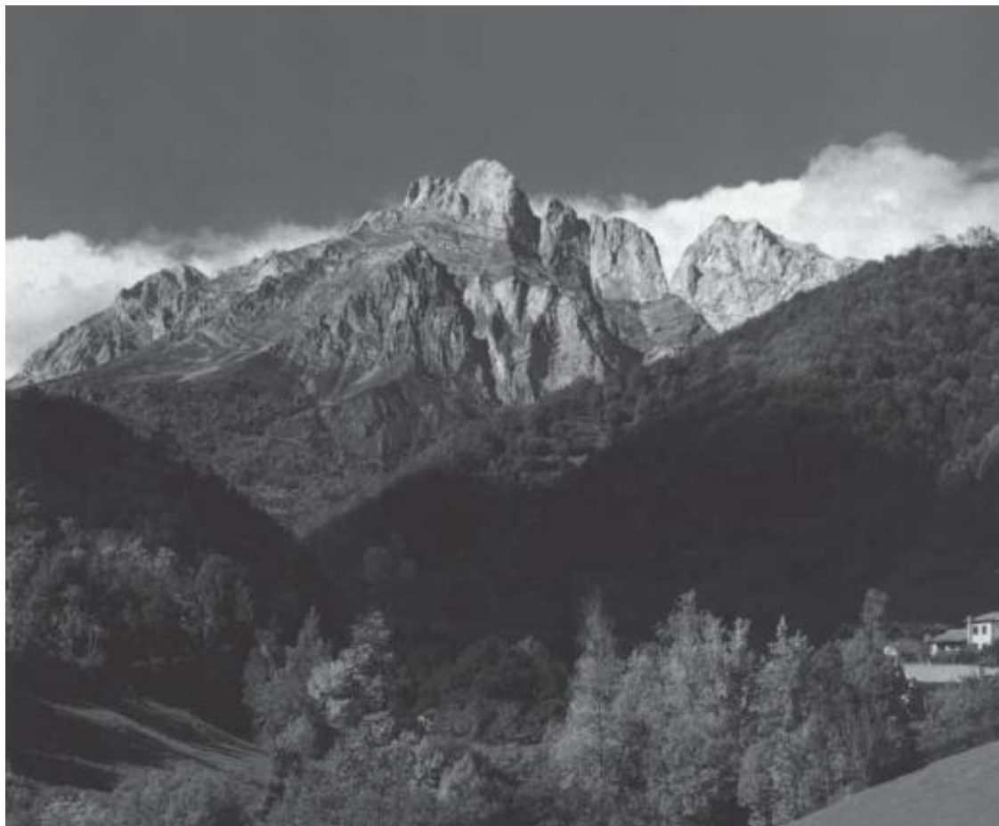
Национальный парк Пикос де Эуропа

году. В северной части парка лежит высокогорное озеро Сан Мауриси в окружении скал, называемых Заколдованные горы, к югу расположено озеро Эстань Негре. Отовсюду открываются виды на сверкающие снежные вершины гор. У границ этого Национального парка находится долина Бои, своего рода заповедник маленьких романских церквей с высокими прямоугольными колокольнями. Мировой известностью пользуются росписи XII века церквей Сан Климент де Тауль и Санта Мария, которые в 1920-х годах были перенесены в Национальный музей каталонского искусства в Барселоне и заменены на месте первоклассными копиями.