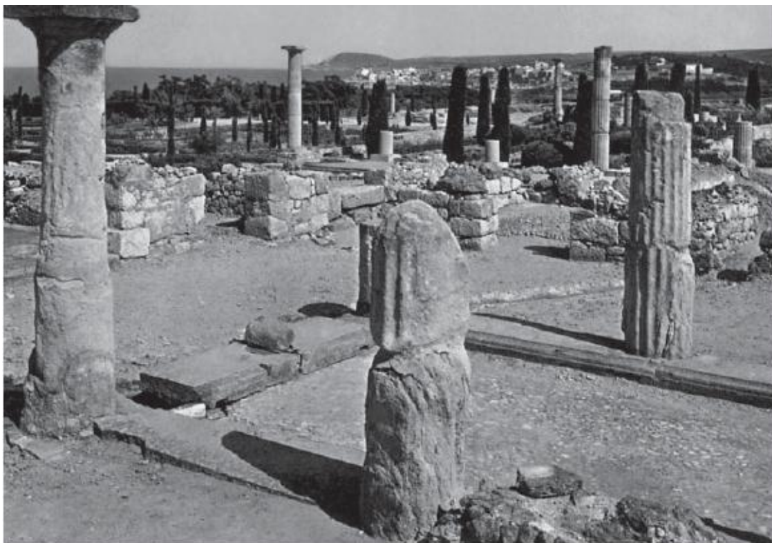
Руины города Эмпурьеса

Постепенно наступило полное забвение Конимбриги, известность которой прежде всего связана с множеством прекрасных красочных мозаичных полов в богатых домах, основания которых сохранились. В среду обитания тяжелых объемов разрушенного города – мощной, словно оплывшей крепостной стены, ее парадных входных ворот, фрагментов форума, терм, акведука, жилых и торговых кварталов, легко вписываются распластанные на земле, безжалостно обнаженные временем мозаичные светлофонные напольные композиции зданий и их перистильных дворов с остатками колонн и затейливыми очертаниями водоемов.