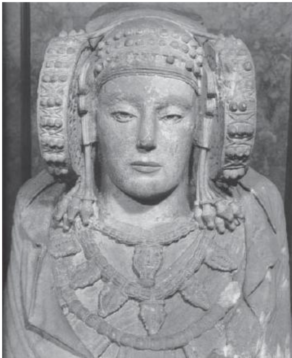
«Дама из Эльче». V–IV века до н. э. Мадрид, Национальный археологический музей

году Национальный парк Монфрагуэ отличается неброской красотой: каменистая земля, сухие дороги, оливковые рощи, склоны холмов и гор, покрытые рощами пробкового дуба, парящие в небе огромные черные грифы, волки, как и тысячи лет назад, живущие в скалах. Доступная ветрам Атлантики, Эстремадура привлекала римских колонистов, создававших здесь безупречную систему водоснабжения, – акведуки, водохранилища, оросительные каналы и мосты, самые знаменитые в римской Испании. В средние века строительная традиция была связана с рыцарскими и монашескими орденами, воздвигавшими здесь укрепленные замки, церкви и монастыри.