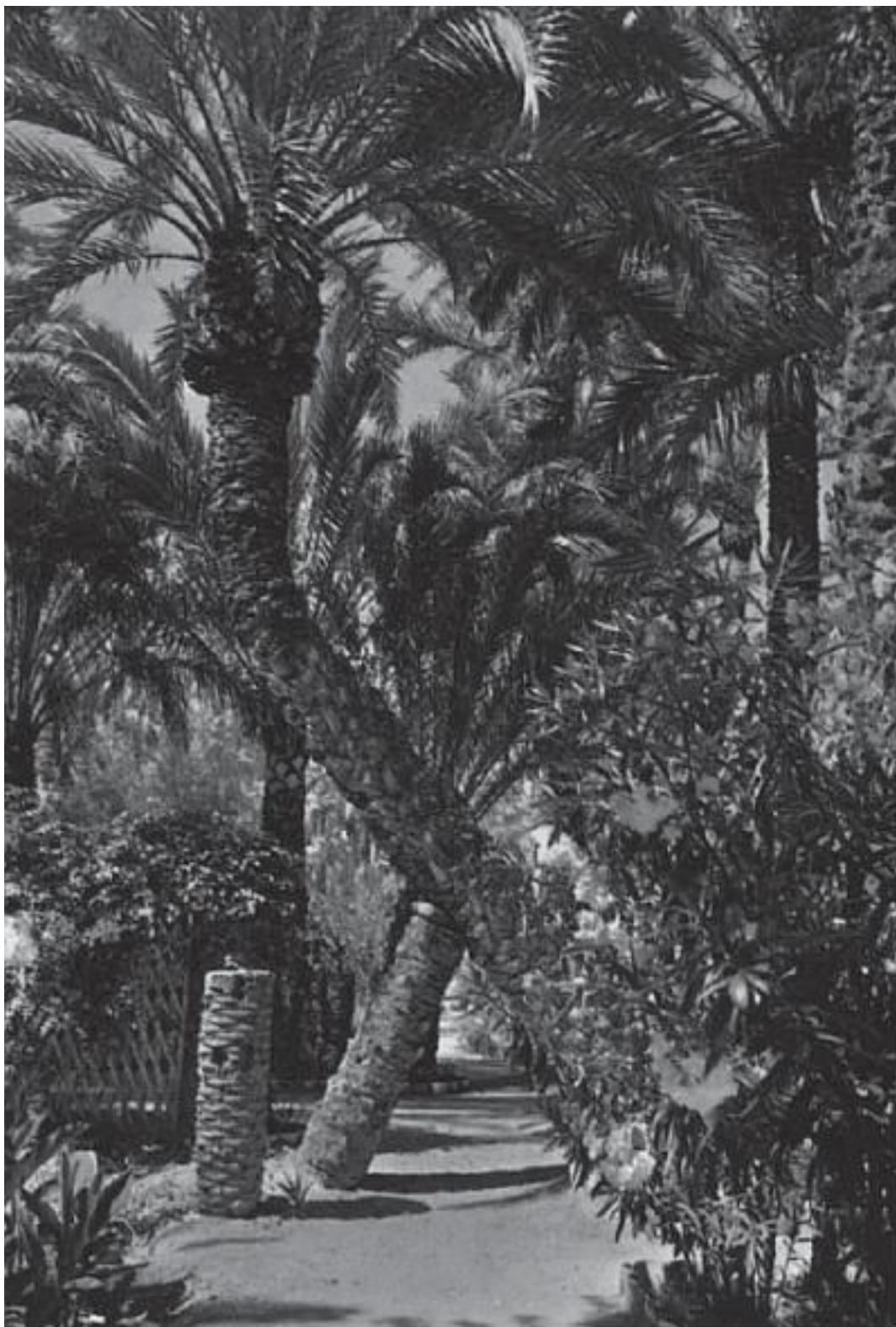
Пальмовая роща в Эльче

Эльче, расположенный в провинции Аликанте, издревле оказался связанным с оживленной торговой и культурной жизнью Восточной Испании; в настоящее время это сравнительно небольшой, но промышленный город. В центральной же части страны граничащая с Португалией малозаселенная Эстремадура, то есть «край за рекой Дуэро», может быть, сильнее всего хранит ощущение дикой природы и остановившегося времени. Основанный здесь в 1979