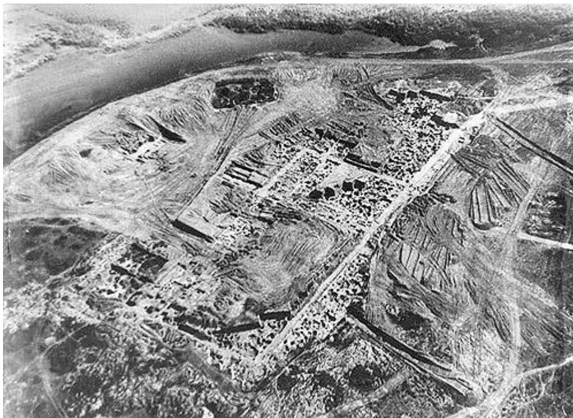
Илл. 2. Раскопки Саркела. Аэрофотоснимок, 1951 г.

Уровень развития ремесла в Саркеле ничем не отличался от общего для каганата. М.И. Артамонов упоминает несколько гончарных печей и косторезное дело. Что касается мастерских, на которые ссылается С.А. Плетнёва, то известна одна (!): «Несомненных следов металлургического производства в хазарском слое Саркела не найдено, за исключением одной кузницы...» (Артамонов М.И. 1958. С. 39~43)–