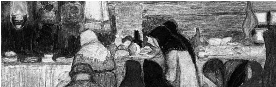
На обороте: В. Кандинский. Молящиеся крестьяне. Фрагмент

На карте, размещенной в записной книжке, которая служила ему дорожным дневником 31 , Кандинский очертил границы Вологодской губернии, охватывавшей обширную территорию и на северо-востоке достигавшую отрогов Урала ( ил. 1 ). Он отметил также маршрут своего путешествия через юго-западные русские районы губернии к северо-восточным зырянским областям с реками Вычегдой и Сисолой, находящимися вдали от Урала ( ил. 2 ) 32 .