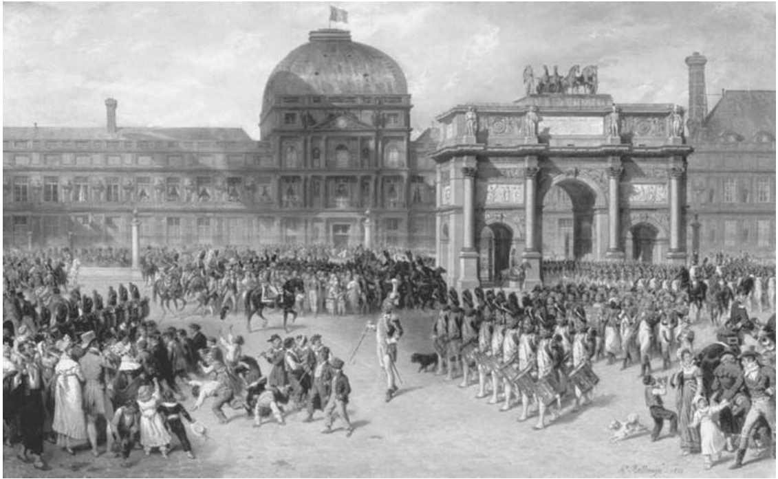
Фрагмент картины И. Белланже «Парад наполеоновских войск у дворца Тюильри. 1810 год»

Историк Жорж Ленотр по этому поводу с сожалением замечает: