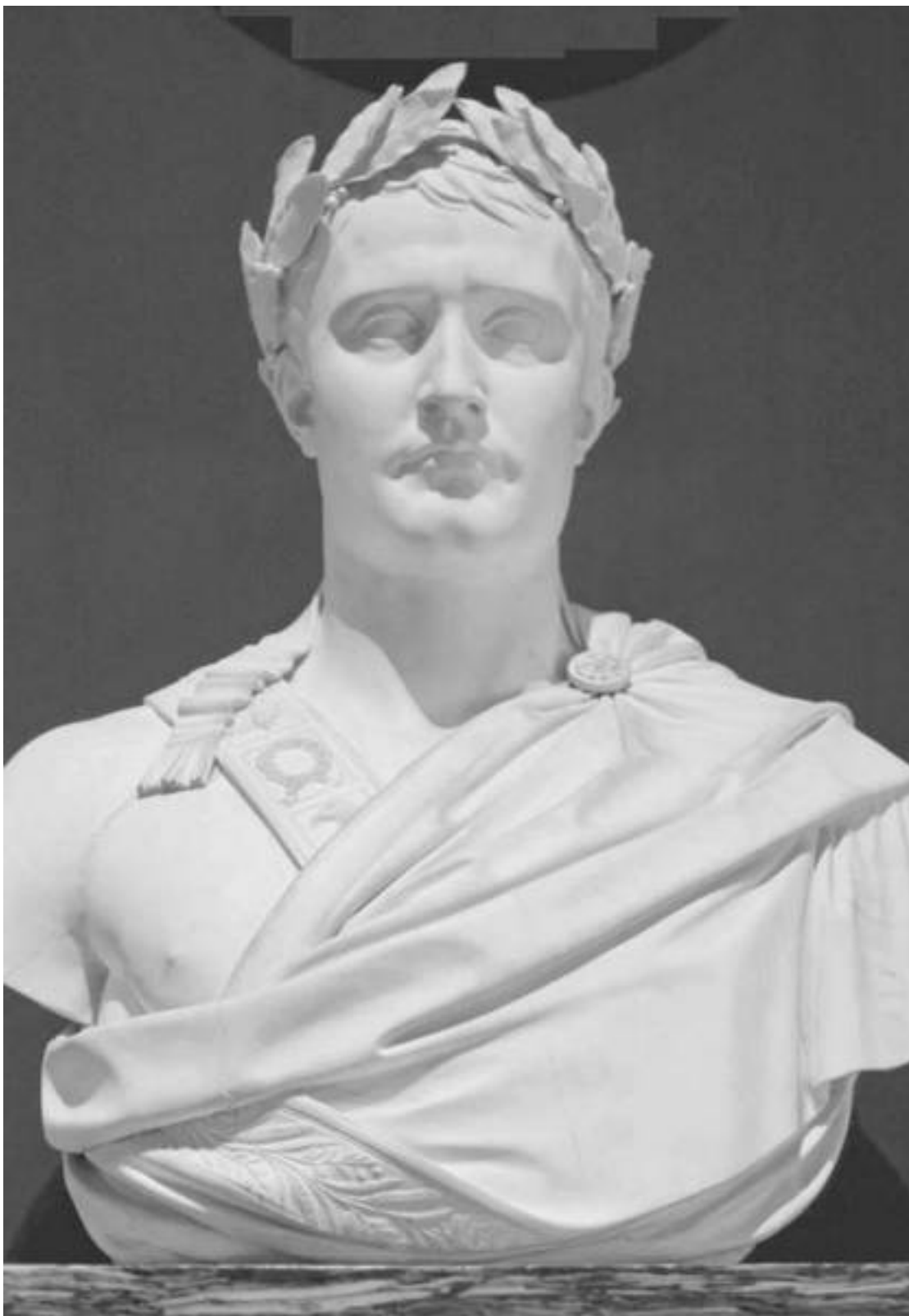
Бюст Наполеона из коллекции Лувра. Севрская мануфактура, по модели А.-Д. Шодэ