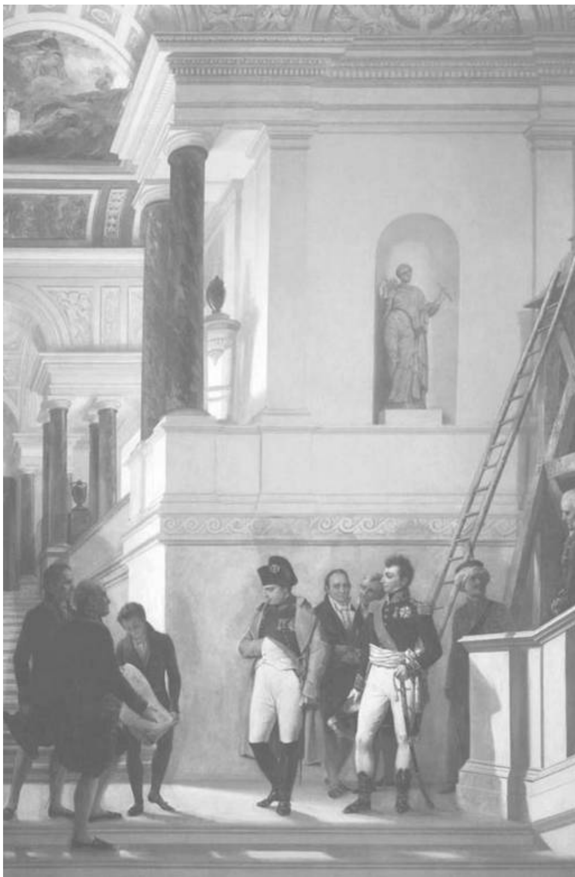
Фрагмент работы Л.-Ш. О. Кудэ «Наполеон в Лувре в сопровождении архитекторов Персье и Фонтена»