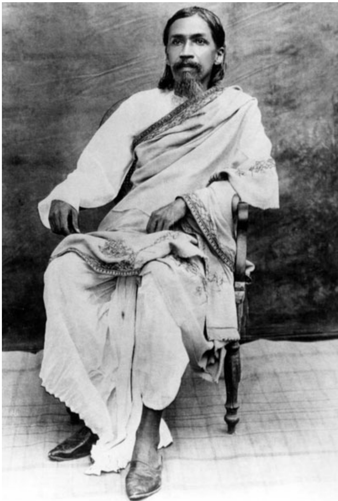
Шри Ауробиндо, Пондичери, 1915—1918 г.