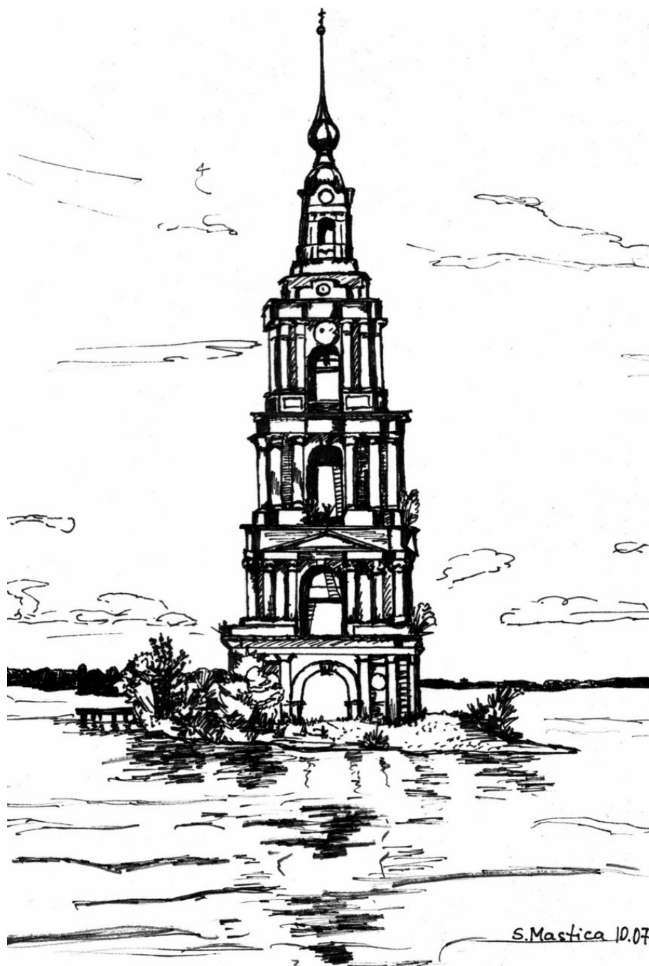
Одиночество. Никольская колокольня. Волга. Город Калязин.