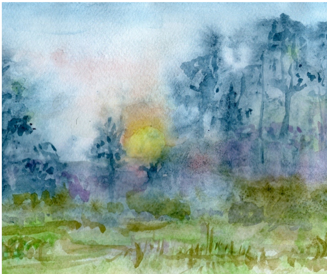
Лес на рассвете