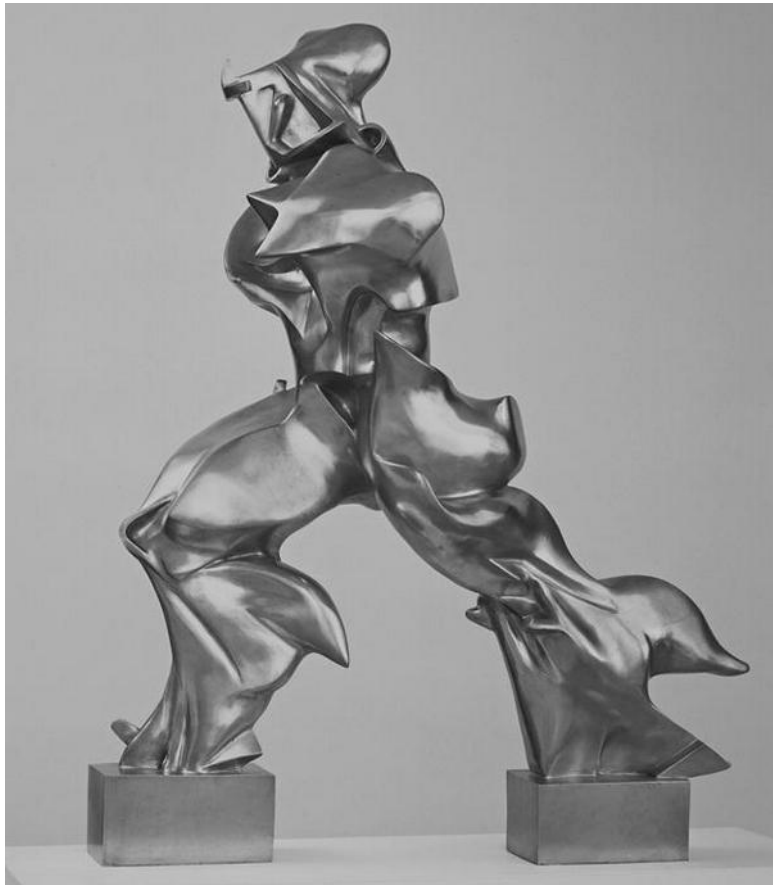
Ил. 1.3. Умберто Боччони. Уникальные формы непрерывности в пространстве (1913, отливка 1931). Бронза, 111,2 × 88,5 × 40 см. Получено по завещанию Лилли П. Блисс. Музей современного искусства (МоМА), Нью-Йорк. Изображе-