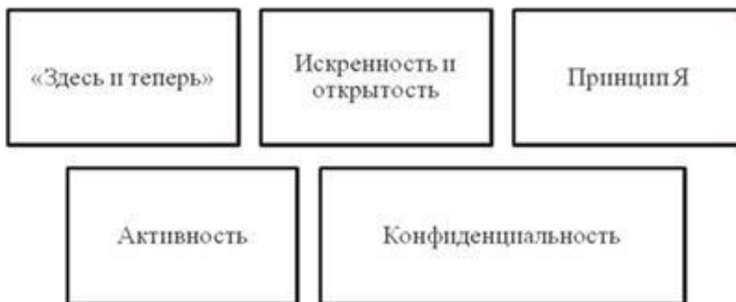
Рис. 2. Правила тренинга, которые характерны для значительного количества тренинговых групп