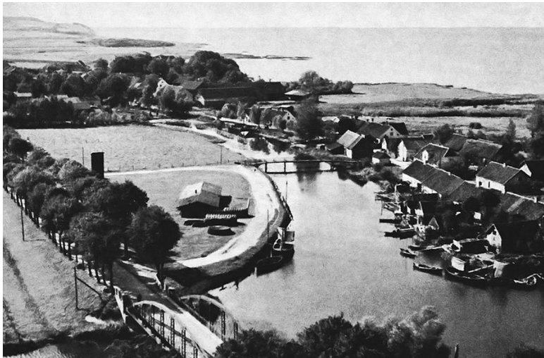
Вид на гавань Бранденбург и залив с башни Орденской кирхи, 30-е годы XX века