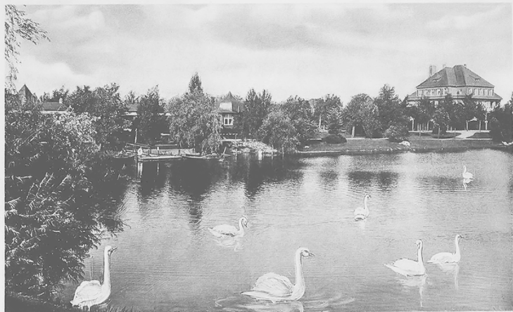
Königsberg, O.-Pr. - Maraunenhof

Променад на озере Обертайх в районе Марауенхоф, 20-е годы XX века