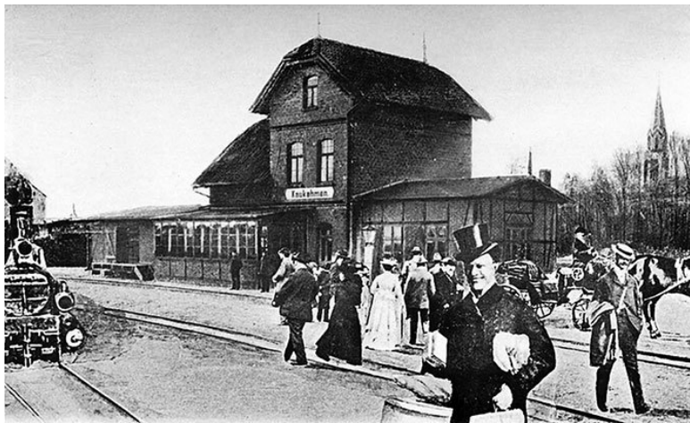
Железнодорожный вокзал в Каукемене, 1918 год

Тевтонцы взяли большую добычу, а крепость Каминисви-ке сожгли. На её руинах и была построена крепость Таммов, которая должна была защищать Восточную Пруссию от литовцев. Но... несмотря на внушительный вид (вал высотой до 15 метров на севере, мощная надвратная башня с подъёмным мостом, ров глубиной 7 метров и шириной 15 метров, деревянный бруствер на крутых берегах и так далее), горела она несколько раз синим пламенем.