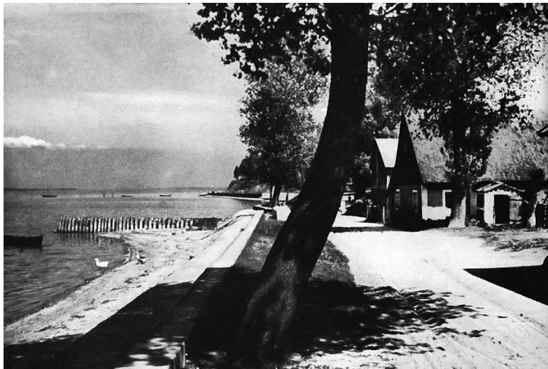
Рыбачьи домики у залива Фришес-Хафф, 20–30-е годы XX века

Кстати, поселение у замка в XVII веке превратилось в крупный населённый пункт. Здесь жили рыбаки, садоводы, лодочник, извозчики, крестьяне. Насчитывалось около пятидесяти дворов и семь трактиров. В «свободном местечке» Бранденбург (так и именовалось оно в середине XVII века) проводились ярмарки.