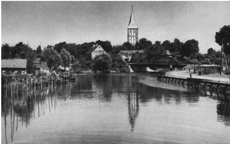
Вид на Бранденбург у реки Фришинг, 30-е годы XX века