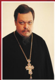
Протоиерей Всеволод Чаплин