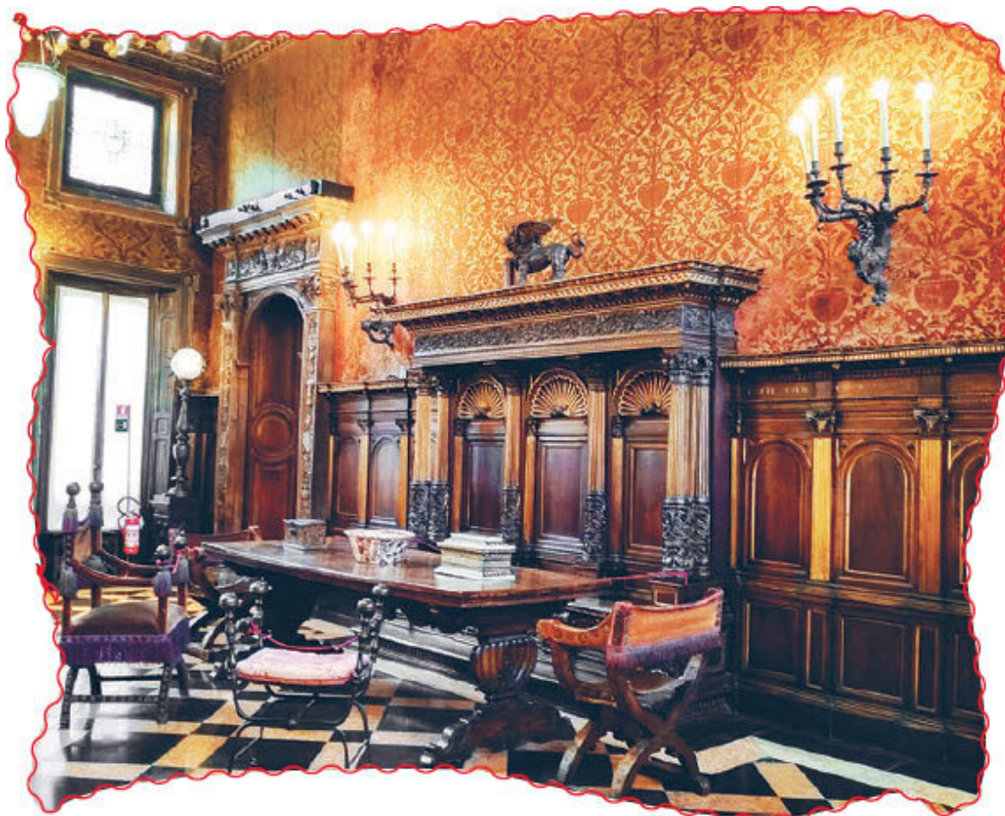
Музей Багатти Вальсекки.

– Она построена по желанию бабушки на месте внутреннего двора.