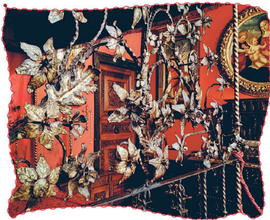
Музей Багатти Вальсекки.