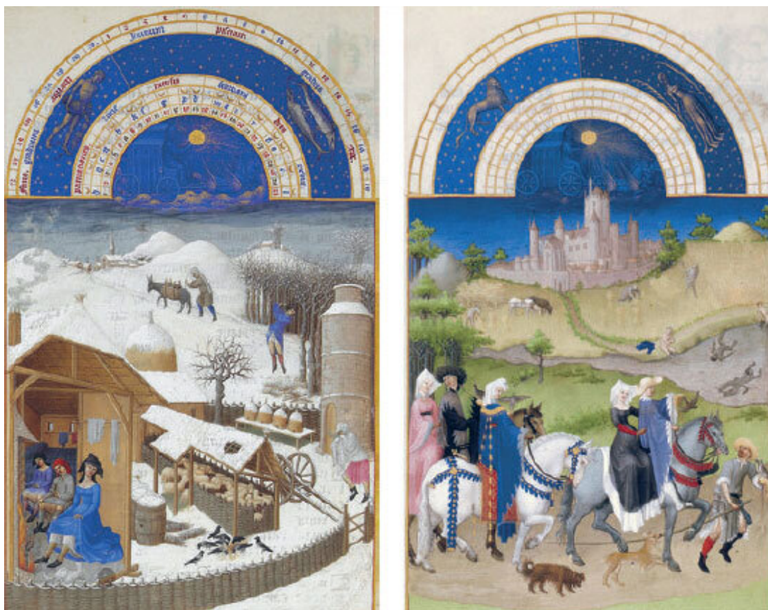
Великолепный часослов герцога Беррийского, цикл «Времена года»: «Февраль», «Август».