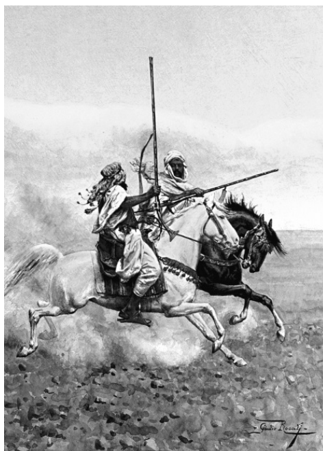
Джулио Розати. «Турецкие наездники»

Но султан держал свое слово: вскоре он послал великого визиря с войском в поход на Восток.