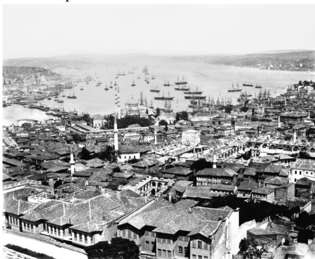
Константинополь. Вид с башни Сераскир