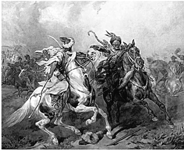
Юлиуш Коссак. «Татарский танец»

А отец, несмотря на грузное телосложение, мгновенно оказался в доме и через мгновение выскочил с саблей и мушкетом, который сразу перехватил гость из Канева.