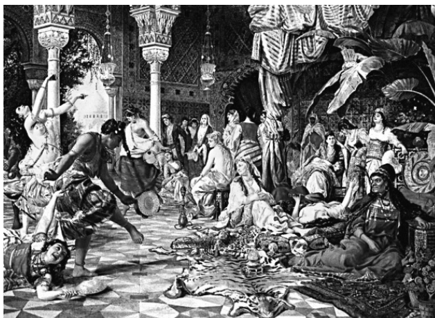
Белисарио Джоя. «Развлечения в гареме»

В этот момент он совсем не был похож на грозного завоевателя, царя царей, об одном упоминании о котором дрожали монархи всего мира. Рослый, стройный, быстрый в движениях, с моложавым смуглым лицом... Черные глаза... Залихвацкие острые усики... Борода... Сулейман напоминал простого парня, жениха, который пришел на свидание к своей суженой. Хотя он был девушке нелюб, но взгляд его – хороший, нежный, ласковый чем-то напоминал (как ни пыталась девушка избавиться от этого сравнения) взгляд одного рогатинского хлопца Семена, с которым она училась у отца Петра.