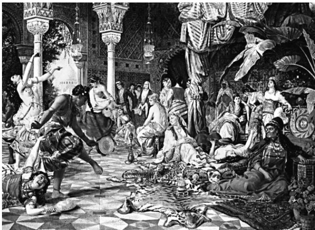
Белисарио Джоя. «Развлечения в гареме»

– Почему грустит моя волшебная Хюррем? – Сулейман торопливо, стремительной походкой вошел в комнату. Слуги неслышно ускользнули прочь. Султан поклонился Насте, сел возле нее, влюбленно, с нежной улыбкой смотрел на девушку.