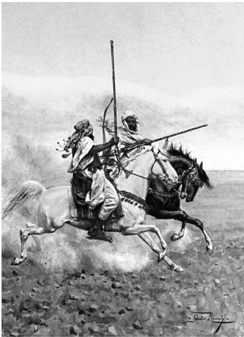
Джулио Розати. «Турецкие наездники»

...Вечерами Настя читала. У нее появился еще один учитель древнегреческого языка. Очень быстро она овладела этим языком и могла читать в подлиннике Гомера. Этим очень гордился султан, хвастался перед всеми иностранными послами.