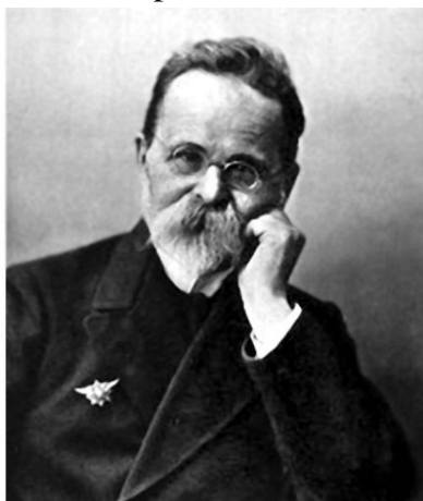
Пуанкаре и Морозов