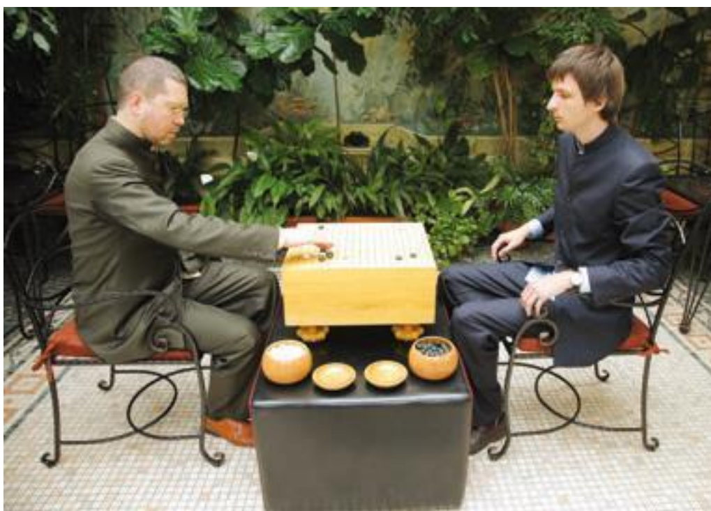
Руки держат на подлокотниках, либо на коленях