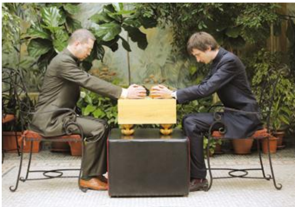
Чаши с камнями берут двумя руками