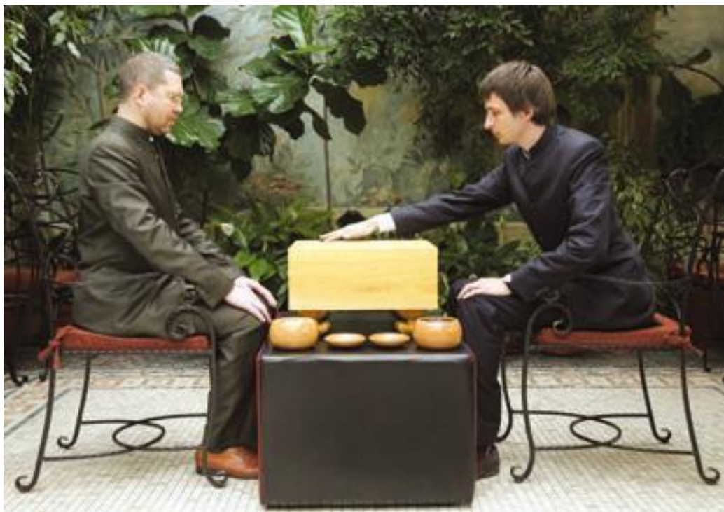
Первый камень ставят в углу, к сердцу партнёра