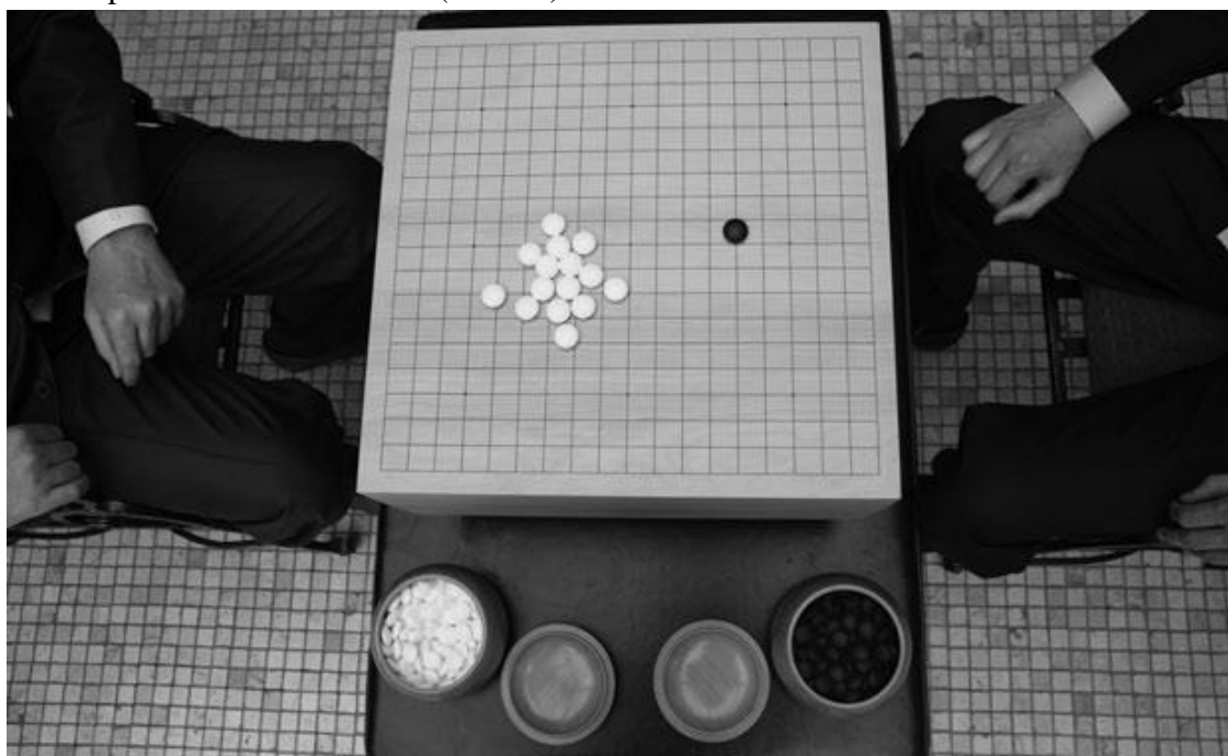
Фото 1. Розыгрыш цвета камней

Чтобы определить, кому достанутся чёрные камни, один из участников берёт в руку из чаши с белыми камнями произвольное количество камней. Другой пытается угадать: чётное или нечётное число камней в руке у партнёра. Он ставит один или два чёрных камня на доску, как бы говоря: «чёт» или «нечет» (Фото 1).