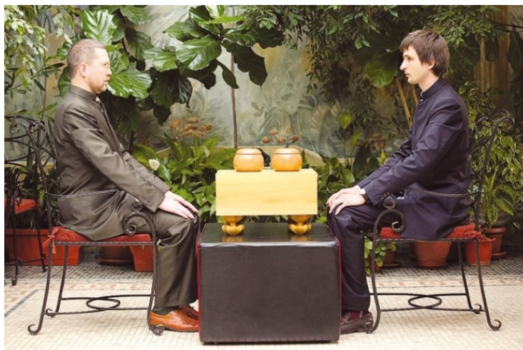
Показательная игра Мастеров Русской Школы Го и Стратегии