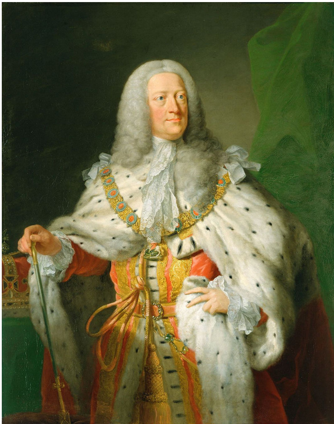
Король Георг II Английский (1683–1760). Юпитер Европы.

Военные последствия Дёттингенской победы не соответствовали ожиданиям ни в Англии, ни в Австрии, где также предвкушали скорую победу над Францией. Но политические результаты кампании в Германии были значительны. Король Георг и его министр Картерет находились в зените славы. Их действия возносили до небес и сравнивали с деяниями герцога Мальборо и принца Евгения Савойского. Как раньше герцог Мальборо и принц Евгений, они привели поход к победному завершению и находились в центре Германии, от них зависели судьбы Европы, а король Георг, по выражению Карлайла, сделался её Юпитером. Лорд Картерет оставался самой влиятельной фигурой в окружении английского короля, и его