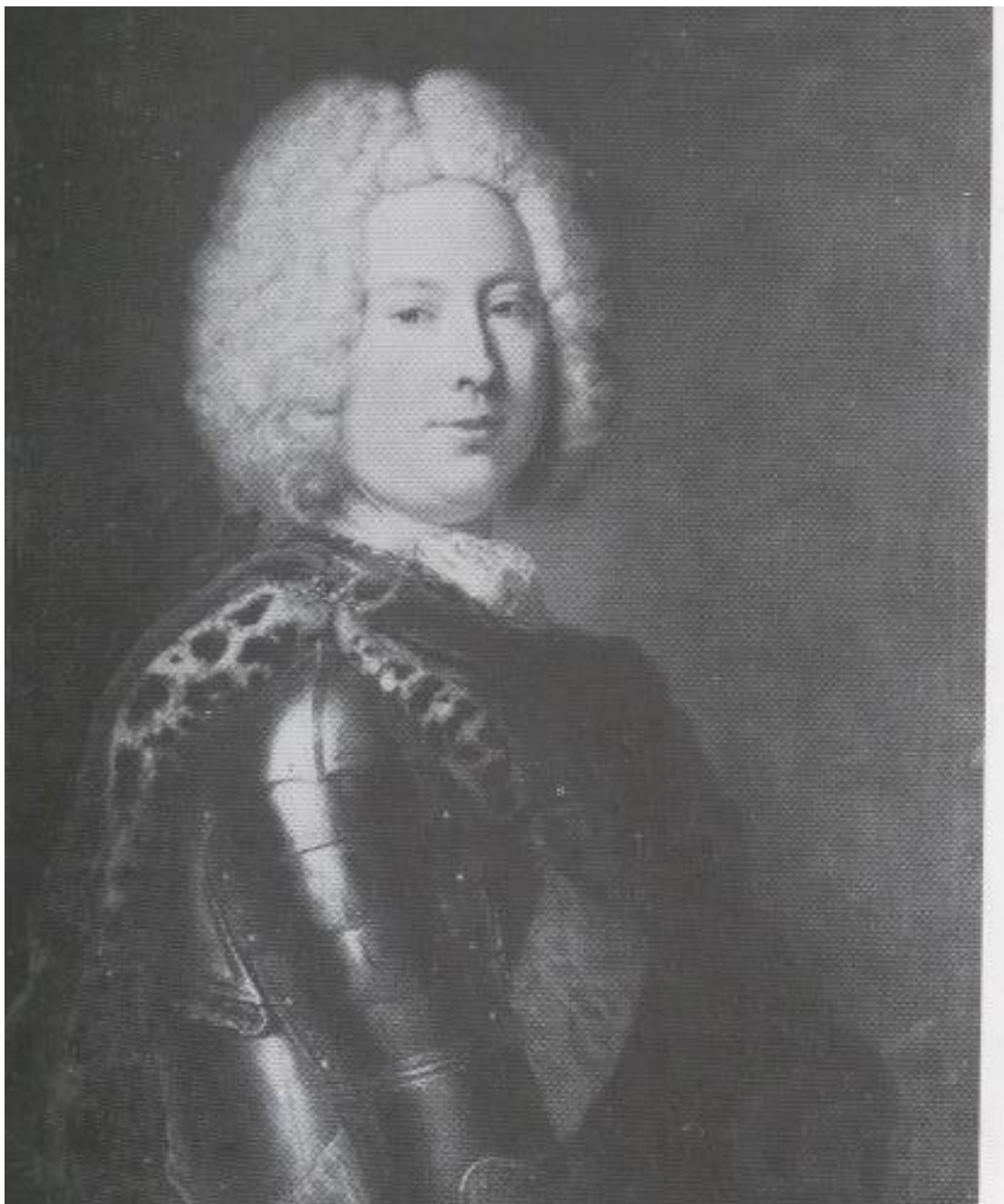
Генрих фон Подевильс, государственный и военный министр Пруссии (1695–1760).

Время покажет, насколько верны были предостережения опытного министра, но сейчас перед королём стояла одна задача – не допустить, чтобы военные неудачи на Рейне перечеркнули все дипломатические успехи последних месяцев. Необходимо было поддержать боевой дух в Версале, куда уже прибыл голландский уполномоченный граф Вассенар (Wassenar), который привёз одобренный Генеральными Штатами и Англией план по умиротворению враждующих сторон. По выражению прусского посланника в Вене графа Дона, это могло стать вторым изданием Утрехтского мира, и эти аналогии были вполне справедливы. После примирения Франции с морскими державами Австрия, оставшись в одиночестве и без субсидий, не смогла бы продолжать войну, и вынуждена была бы также заключить мир, рассчитывая при этом найти удовлетворение в другом месте. И место это было слишком хорошо известно прусскому королю, чтобы он мог спокойно наблюдать за происходящими событиями. Поэтому 12 июля,