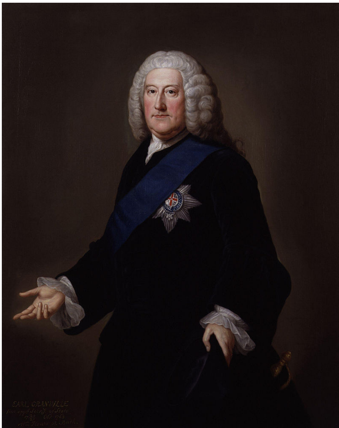
Джон, граф Гранвиль, лорд Картерет (1690–1763).

Получив ответ из Лондона, лорд Картерет, к всеобщему удивлению, передал штатгальтеру, что он не может подписать «Проект гарантий» и английское министерство не будет помогать императору Карлу VII в его затруднениях. Переговоры закончились безрезультатно, но они представляют особый интерес, так как имели серьезные последствия. Во-первых, во время них произошло резкое размежевание в английском министерстве, что позже повлияет на отставку лорда Картерета. В Лондоне попытка поддержать Карла VII была расценена как очередная уступка ганноверским интересам в ущерб английским. В министерстве возмущались, что огромные средства были потрачены как раз для того, чтобы впредь не обманывать себя переговорами, как это продолжалось в течение последних двадцати лет. Другим следствием