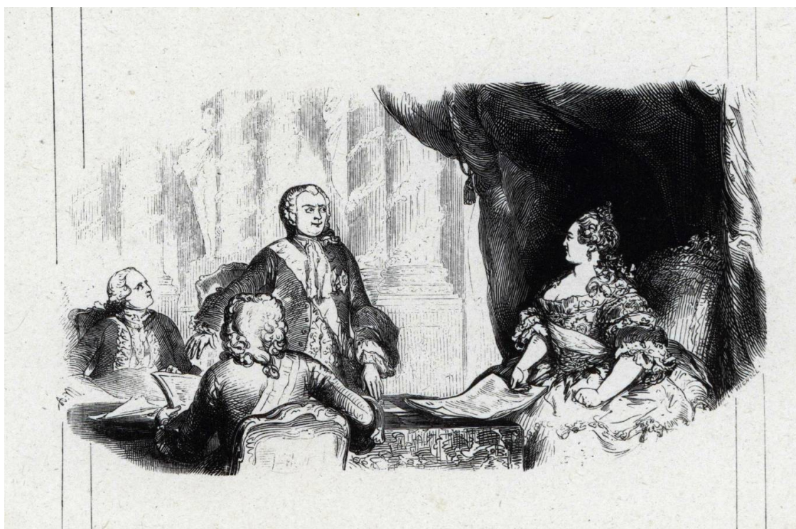
А. Менцель. Императрица Елизавета выслушивает доклад вице-канцлера графа Бестужева-Рюмина.

Русский двор, не желая открытой конфронтации с Пруссией, пытался избежать вмешательства в конфликт и одновременно сохранить в силе обязательства по договору. Это требовало тонкой и осторожной политики от вице-канцлера Бестужева, связанного нежеланием