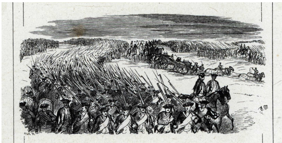
А. Менцель. Пехота на марше.

из Хамма (Hamm) – за 16 дней 42 мили (311 километров). Большой конвой из 500 судов под командованием Бонина ещё 10 августа покинул Магдебург и, не встречая препятствий с саксонской стороны, миновал Дрезден и Пирну и проследовал вверх по Эльбе к Лейтмерицу. Всё шло так, как задумал король. Прусские войска во время марша соблюдали порядок, за нарушение дисциплины было предписано строгое наказание. В случае выявления насильственных действий по отношению к местному населению солдат ожидала смерть, а офицеров – позор разжалования. В кабинет-приказе, изданном королём в Потсдаме 13 августа, значится, что ни в Саксонии, ни в Богемии не должно быть ни малейшего грабежа. В войсках поддерживался высокий моральный дух, а местное лютеранское население встречало пруссаков без всякой враждебности и даже доброжелательно. Для сбережения собственных припасов и экономя на их подвозе, прусские солдаты в Саксонии покупали продовольствие у местного населения, расплачиваясь наличными деньгами, для чего каждому были выданы, так называемые, «хлебные грóши». При закупках фуража и подвод выдавались расписки, которые потом были погашены из прусской казны, а сельских старост обязали докладывать о порядке в проходящих через их земли полках.