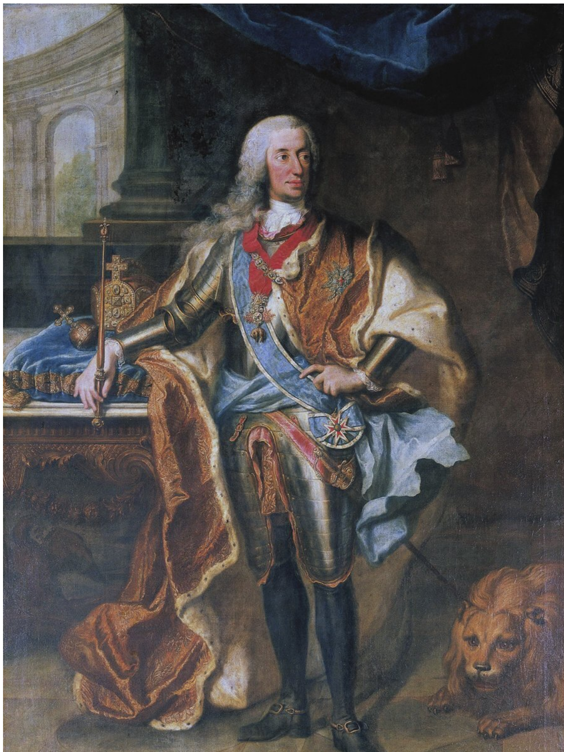
Император Священной Римской империи Карл VII Виттельсбах (1697–1745). Счастливый курфюрст – несчастный кайзер.

Неуступчивость и явно завышенные требования Карла VII вызвали удивление и раздражение прусского короля, который понимал неприемлемость данных условий для Лондона и Вены и пытался убедить императора, что союз с Францией бесперспективен, добиться уступок от Марии-Терезии невозможно, и, таким образом, секуляризация некоторых церковных владений остаётся единственным способом прийти к соглашению. Но надеждам на секуляризацию, которая позволила бы сгладить острые углы территориальных споров, и которую король