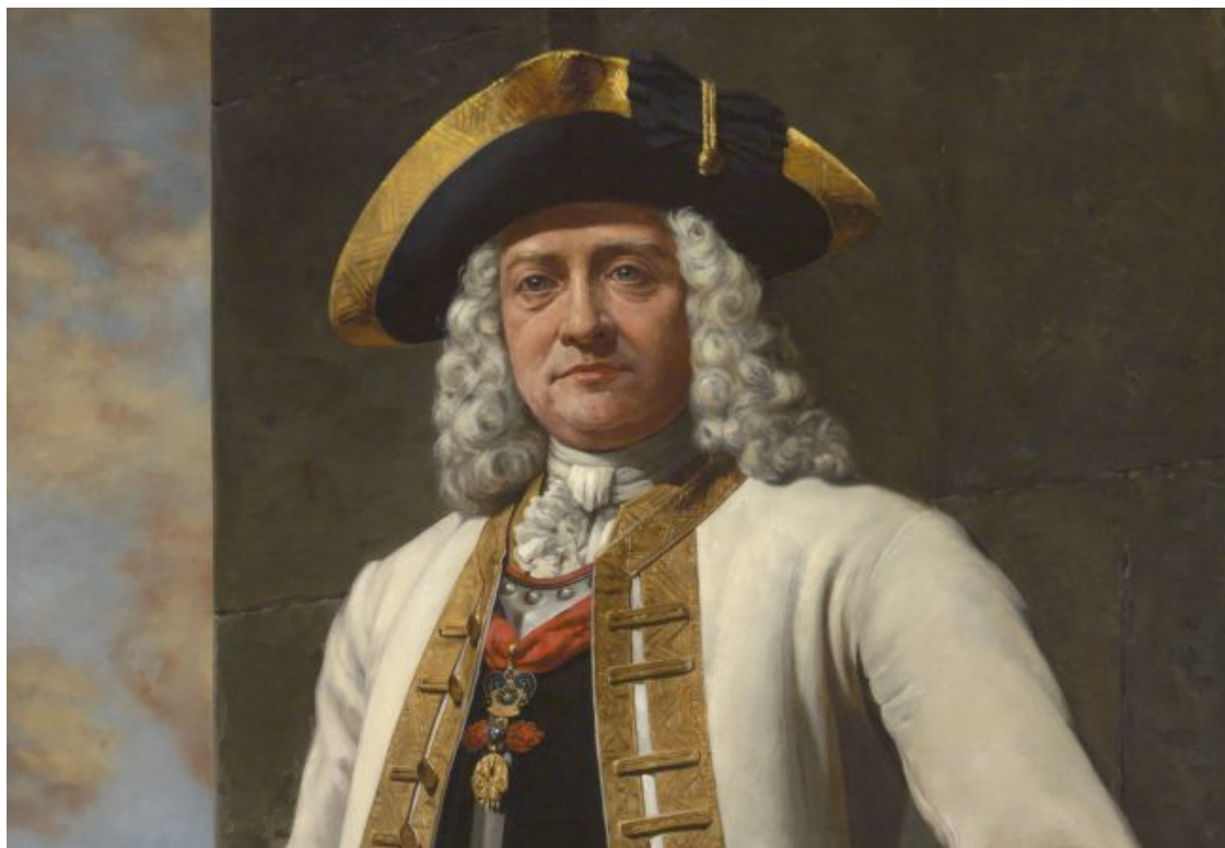
Фельдмаршал Траун (1667–1748). Один из лучших полководцев Марии-Терезии.