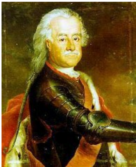
Леопольд I, князь Ангальт-Дессауский (1676–1747), «Старый Дессауец».

отмечен многими славными деяниями. На начало войны за Австрийское наследство это был самый опытный генерал Европы. Король ревниво относился к его славе и не взял князя с собой в Силезию в 1740 году, опасаясь оказаться в его тени. Также и сейчас, Его Прусское Величество оставил своего лучшего генерала в Пруссии, доверив ему ответственную, но неблагоприятную задачу по защите границ Марки на случай осложнений с соседними Саксонией или Ганновером. Как и в 1740 году князь был задет таким пренебрежением, но уже через несколько месяцев у него вновь появится возможность употребить свой опыт и полководческий талант во славу Пруссии 77 .