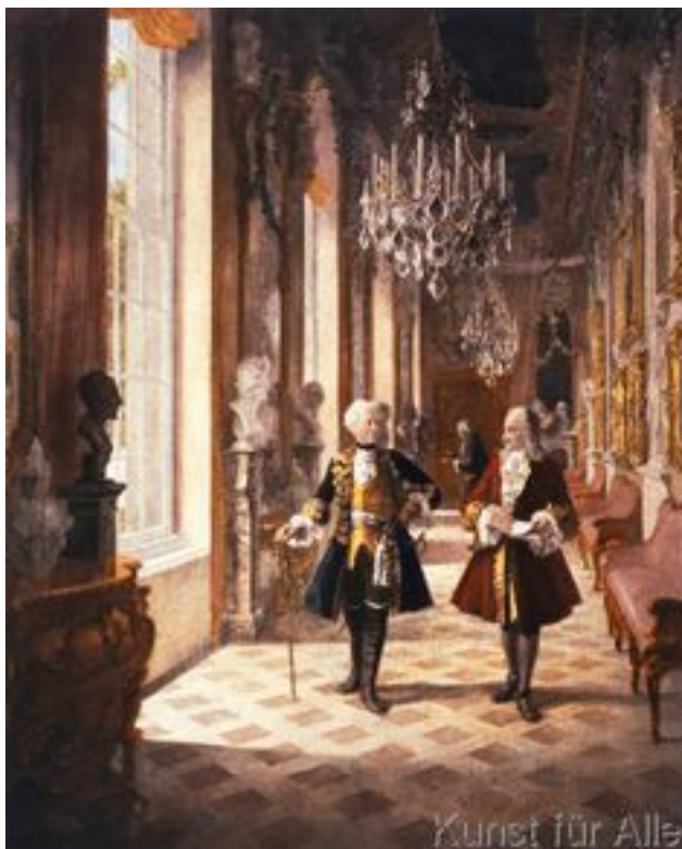
Король Фридрих и Вольтер беседуют во дворце Сан-Суси.

совом отношении и либо вообще не имели полевых войск, либо не могли самостоятельно их содержать и нуждались для этого в субсидиях. Так как ни Пруссия, ввиду ограниченности её ресурсов, ни, тем более, император Карл VII, не могли обеспечить необходимую финансовую поддержку этому предприятию, король Фридрих не видел иного выхода, как обратиться за помощью к Франции. Кроме того, после оставления Баварии, отступления французских войск к своим границам и подписания Нидер-Шёнефельдской конвенции сторонники Карла VII в Империи были подавлены и финансовые гарантии Франции и военные гарантии Пруссии были необходимы, чтобы вновь вдохнуть в них уверенность.