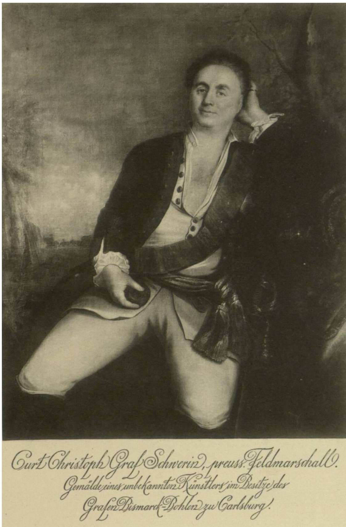
Прусский фельдмаршал Курт Кристоф, граф Шверин (1684–1757). В несколько необычном виде.