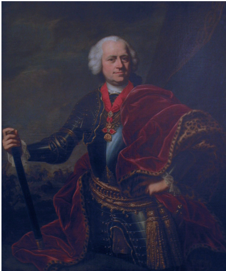
Карл Иосиф, граф Баттяни (1697–1772). Австрийский полководец, позже воспитатель молодого эрцгерцога и бу-