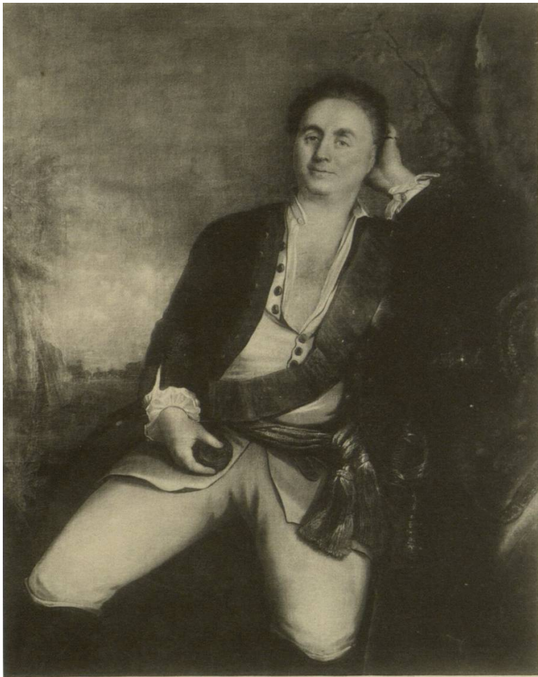
Curt Christoph Graf Schwerin, preuss. Feldmarschall. Gemälde eines unbekannton Künstlers im Besitze des Königl. Museums zu Berlin.