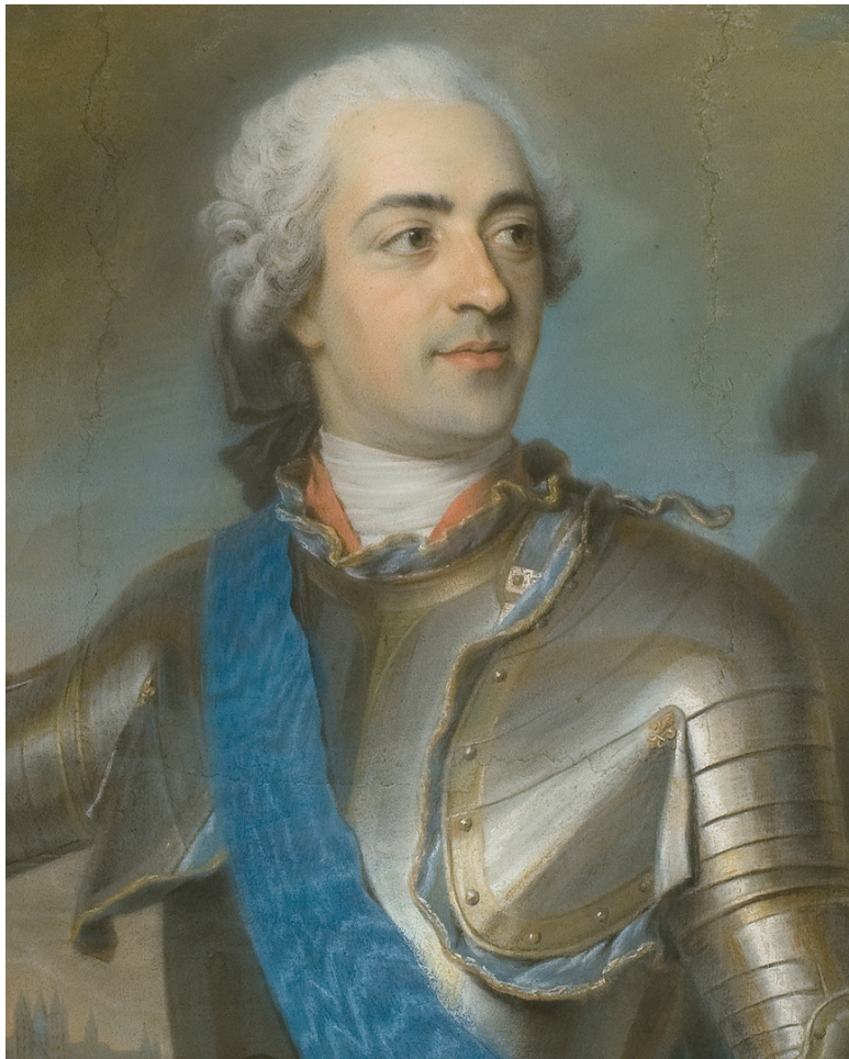
Король Франции Людовик XV (1710–1774). После выздо-