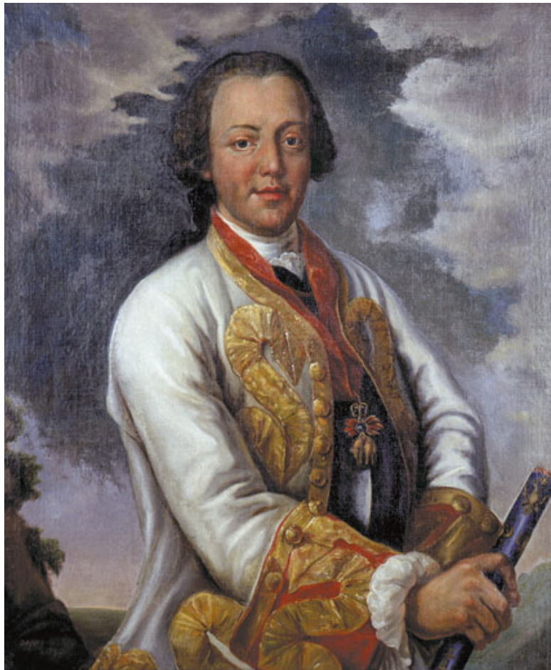
Принц Карл Александр Лотарингский (1712–1780). Ко-