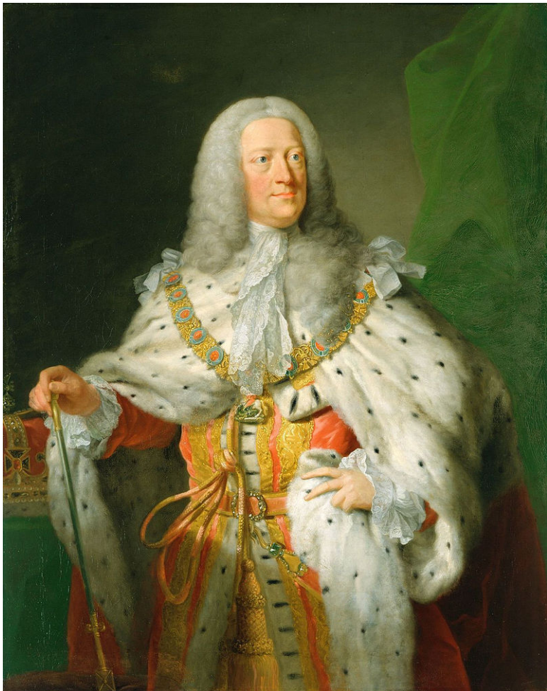
Король Георг II Английский (1683–1760). Юпитер Евро-