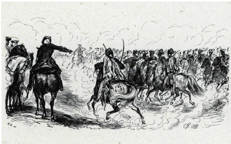
А. Менцель. Король Фридрих на смотре гусарского полка.

Цитена (Zieten). Более значительные манёвры состоялись 30 сентября 1743 года, когда большое полевое укрепление было атаковано одной кавалерийской и двумя пехотными колоннами с участием Жандармов и Гард дю Кор (Garde du Corps). Также упорядочена была служба снабжения. Был сформирован внушительный армейский обоз из 468 повозок, запряжённых четырьмя лошадьми или волами. Согласно новому регламенту от декабря 1742 года дистанция одного перехода была установлена в 2–2,5 немецкие мили (немецкая миля = 7 420 метров), а темп перехода составлял 1,5 мили за 2 часа по хорошим дорогам.