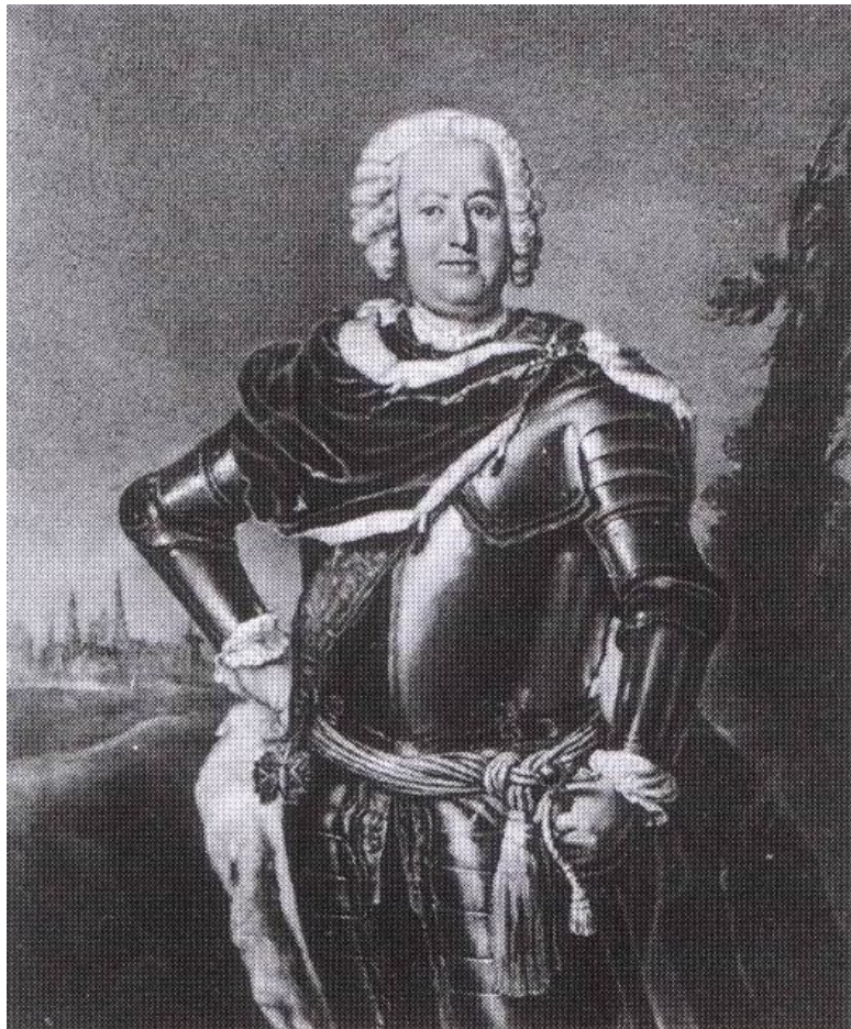
Леопольд II Максимилиан Ангальт-Дессауский (1700–1751), прусский фельдмаршал и один из лучших прусских