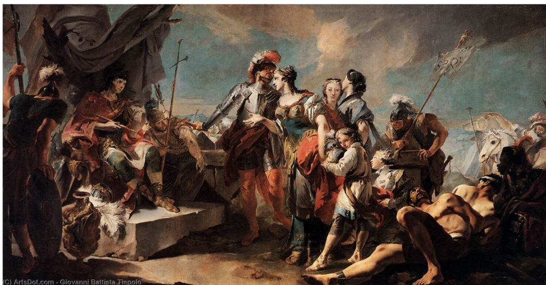
Giovanni Battista Tiepolo – Il trionfo di Aureliano

Падение Пальмиры было предрешиено. Царица Зенобия оказалась в полной власти Аврелиана. Ее генералы и советники были казнены, она же сама – помилована.