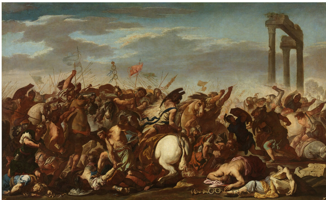
Aniello Falcone – Battle scene, between 1630 and 1665

Римская конница резко развернулась, зашла с обоих флангов и окружила противника. В страшной неразберихе катафракты теряли тяжелые копья, их легко вышибали из седел, они гибли под копытами своих и вражеских лошадей. Избиение продолжалось более двух часов, по истечении которых пятитысячный отряд тяжелой пальмирской конницы прекратил свое существование.