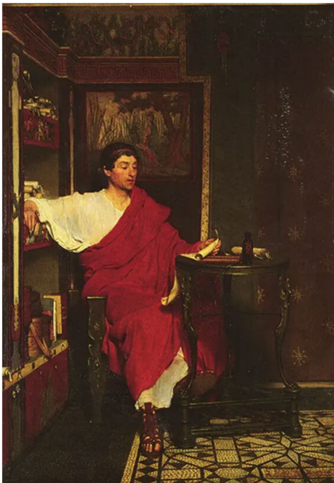
Lawrence Alma-Tadema A Roman Scribe Writing Dispatches, 1865

Разобравшись с записями, она постигла суть двойного учета. Половина добытого золота и серебра уходила из-под контроля государства.