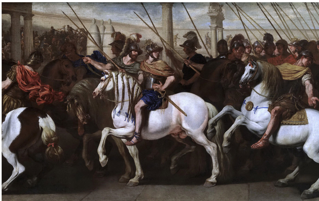
Aniello Falcone – Roman soldiers in the circus, circa 1640

Алу Констанция усилили дополнительными турмами и приписали к Наиссу. Рядом с городом подготовили место для строительства большого каструма, при котором находилось Марсово поле, пригодное для обучения конницы.