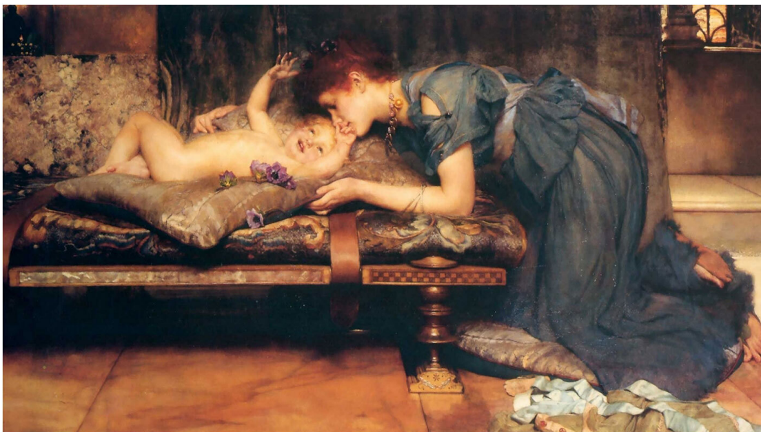
Lawrence Alma-Tadema – An Earthly Paradise (detail)

Маленький Константин хорошо переносил походную жизнь: прекрасно спал и с аппетитом ел. Спустя несколько лет родители ему рассказали: в свой первый военный поход он отправился в возрасте одного месяца.