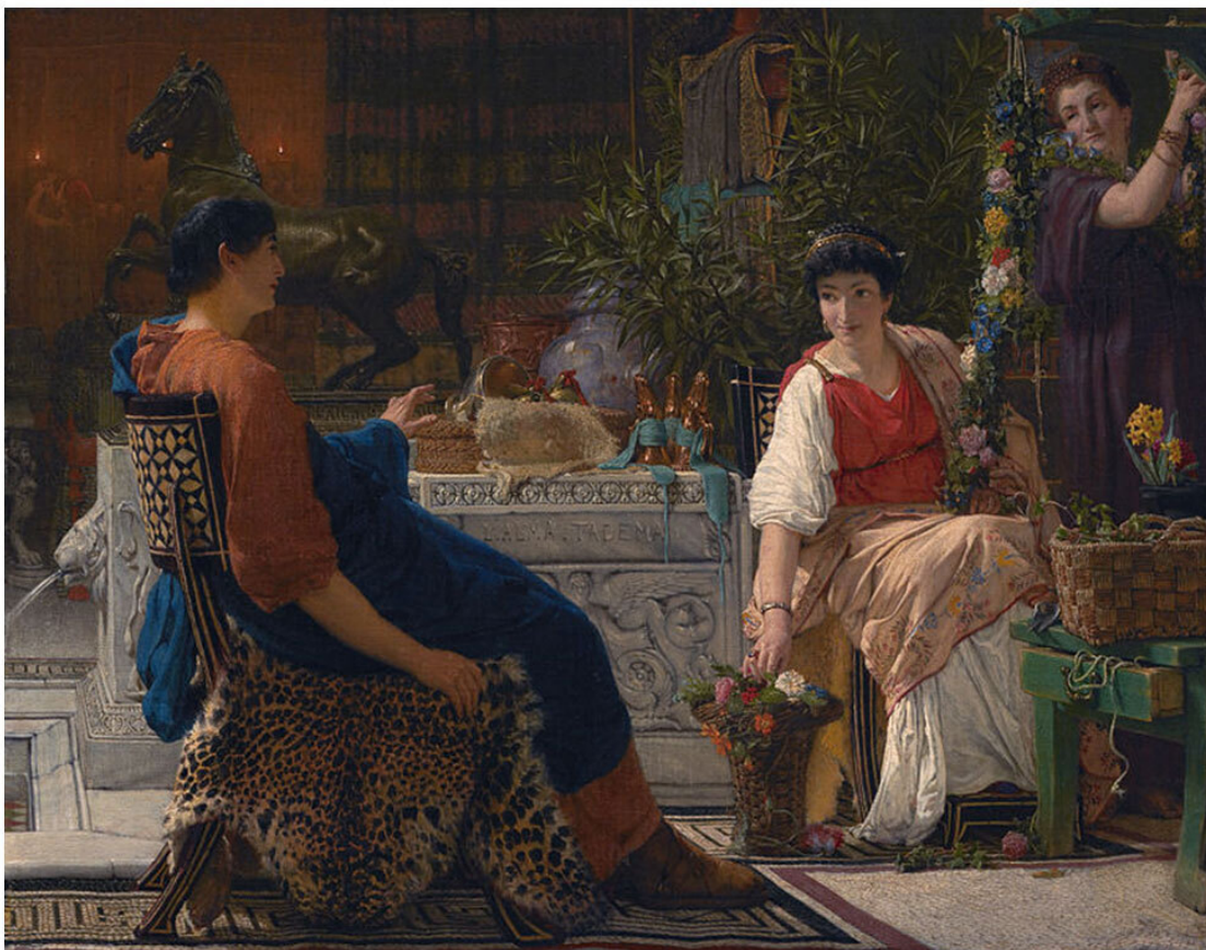
Lawrence Alma-Tadema – Preparations for the festivities, 1866

Сатурналии – праздник, который предписывал веселиться хозяевам и рабам всю неделю. Родители Констанция преподнесли Елене традиционные подарки – забавные восковые фигурки – и пригласили в храм Сатурна совершить совместное жертвоприношение. И тут ей пришлось признаться, что она христианка и чтит единого Бога.