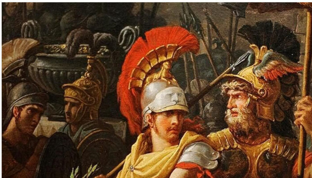
Carle Vernet (French, Bordeaux – The Triumph of Aemilius Paulus, 1789 (detail)

У ворот форта Констанций разделил декурию на две группы: пятеро остались с лошадьми, получив наказ никого не выпускать, остальные последовали за своим командиром.