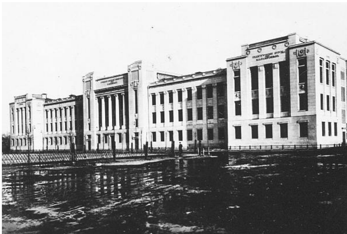
Городской народный Университет имени А. Шанявского на Миусской пл. 1912 г.