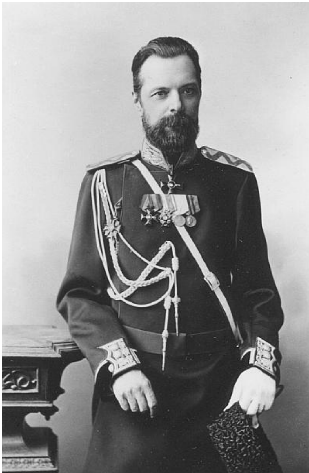
А. Л. Шанявский. 1880-е гг.