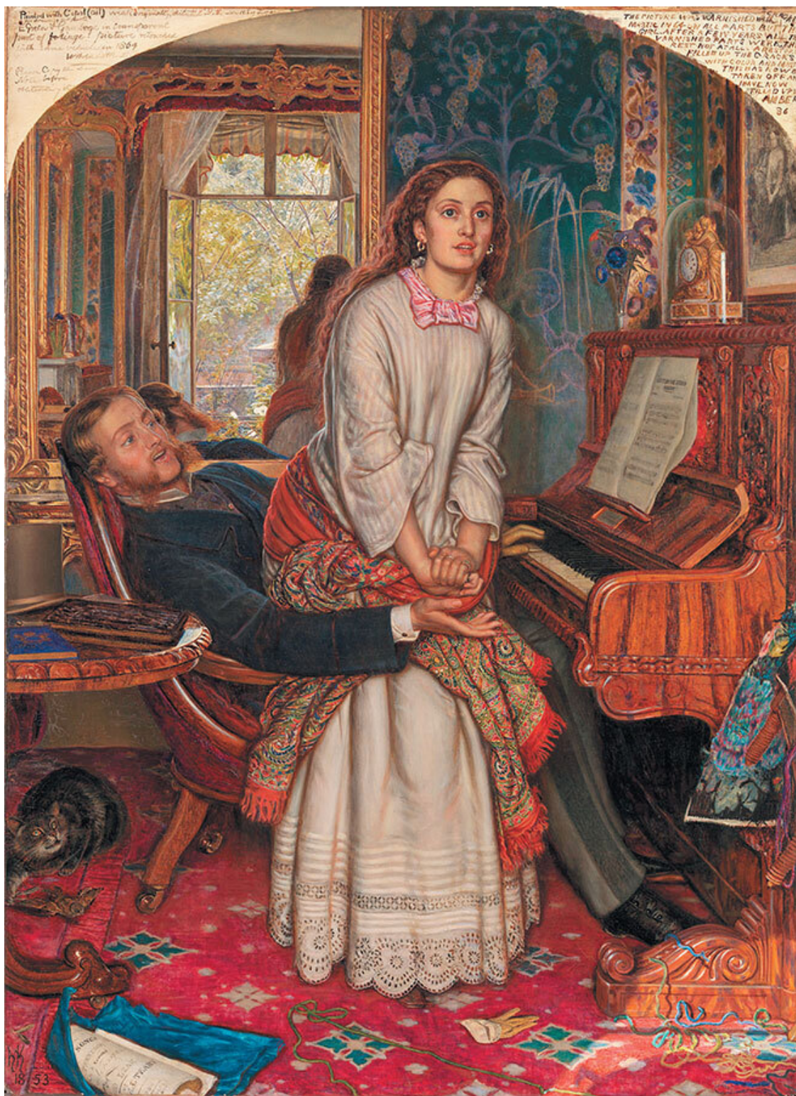
Уильям Холман Хант. Проснувшаяся совесть. 1853