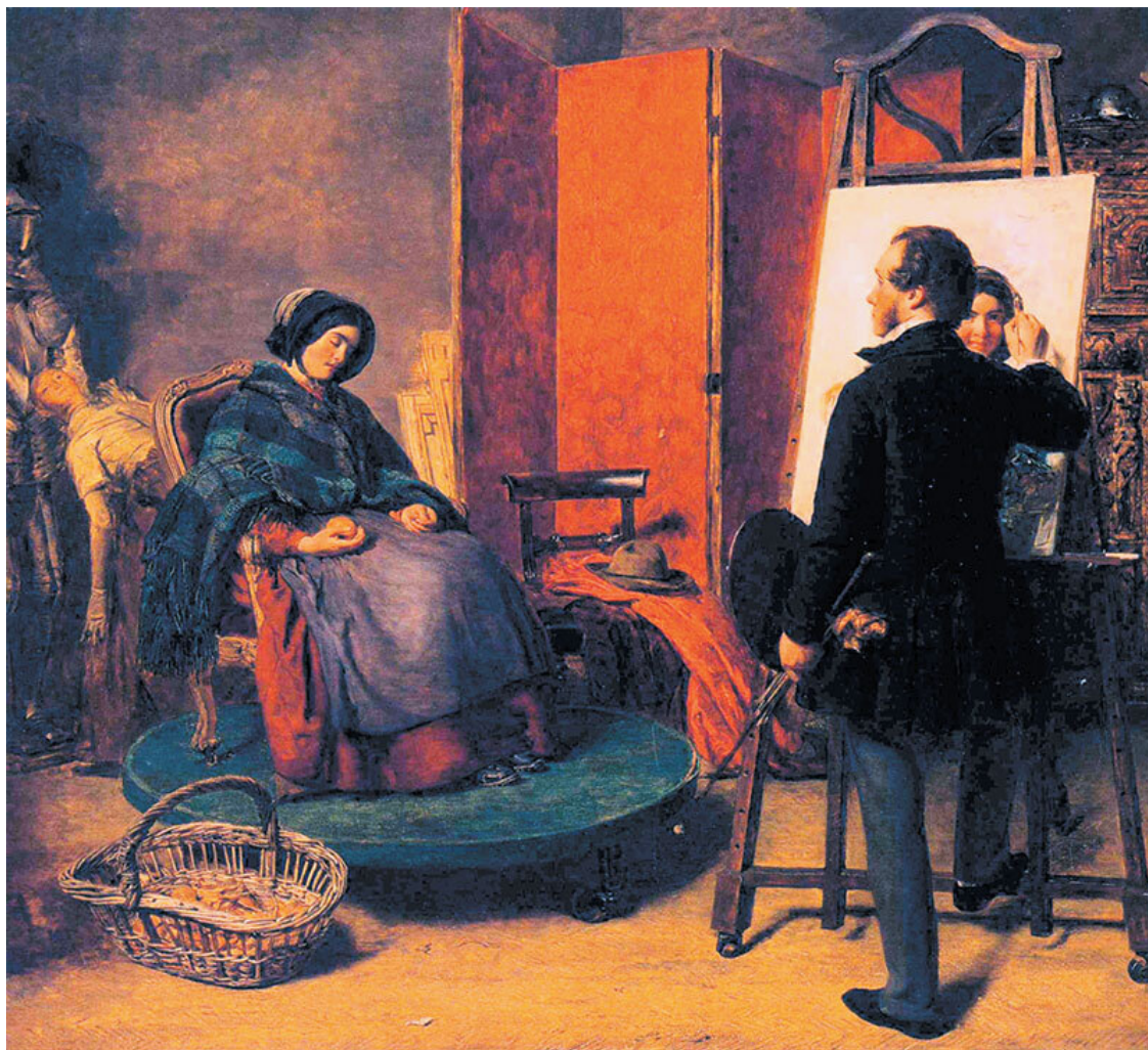
Уильям Пауэлл Фрит. Спящая модель . 1863

Публике викторианской эпохи нравились сентиментальные и дидактические произведения, и работы такого рода имели огромный успех. Имя Уильяма Пайелла Фрита стало первым в списке модных художников. Он выбирал праздничные и бытовые жанровые сценки, привлекательные для широкой публики анекдоты и небольшие дидактические истории о награжденной добродетели и наказанном пороке. Его картины воспринимались словно репортажи, изложенные языком живописи.