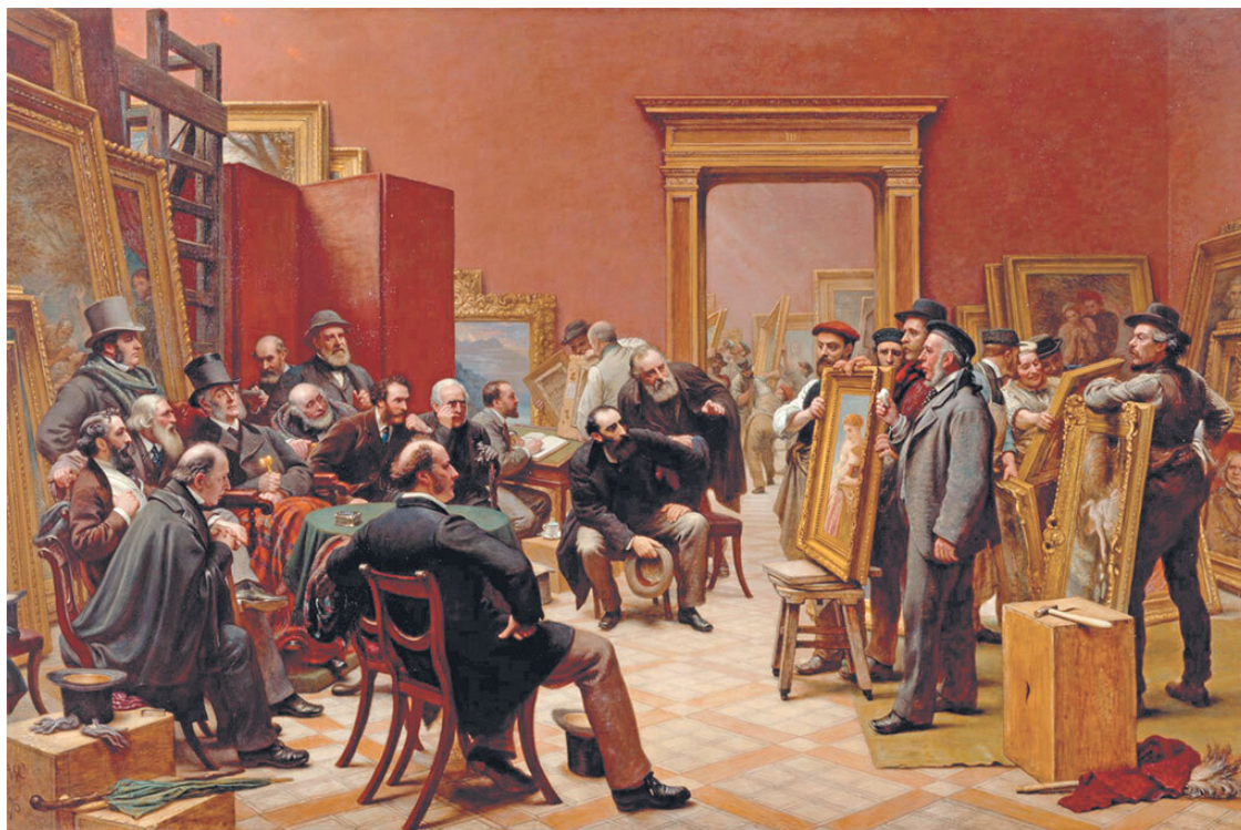
Чарльз Уэст Коуп. Совет Академии Художеств отбирает картины для выставки. 1875

стебл, Генри Реберн, Уильям Тернер, Томас Лоуренс и многие другие. Академия несколько раз меняла помещения, но в 1868 году, через сто лет после своего основания, окончательно утвердилась в здании Бёрлингтон Хауса на улице Пикадилли, где располагается и по сей день.