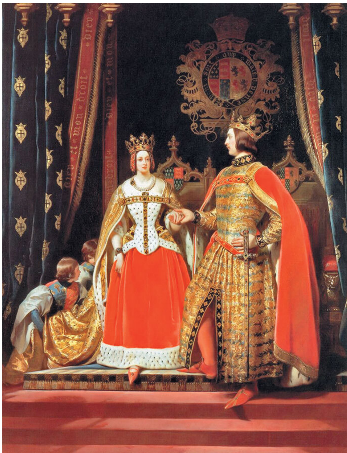
Эдвин Генри Лэндсир. Королева Виктория и принц Альберт на костюмированном балу 12 мая 1842 года. 1842–1846

В викторианском искусстве была принята тщательность реконструкции, избегание выдумок, стилизаций. В 1845 году президент Академии советовал студентам: «Художник, намеренный иллюстрировать исторические события, не должен выходить за рамки хроник. Он связан с объектом узами истины и должен ограничивать свое воображение областью фактов. Поскольку он имеет дело с реальными событиями, описанными в хрониках... то должен тщательно соблюдать правильность времени и места – манер, характеров и костюмов века и страны, в которой происходит сцена». Критиками приветствовалось изображение событий из жизни короля