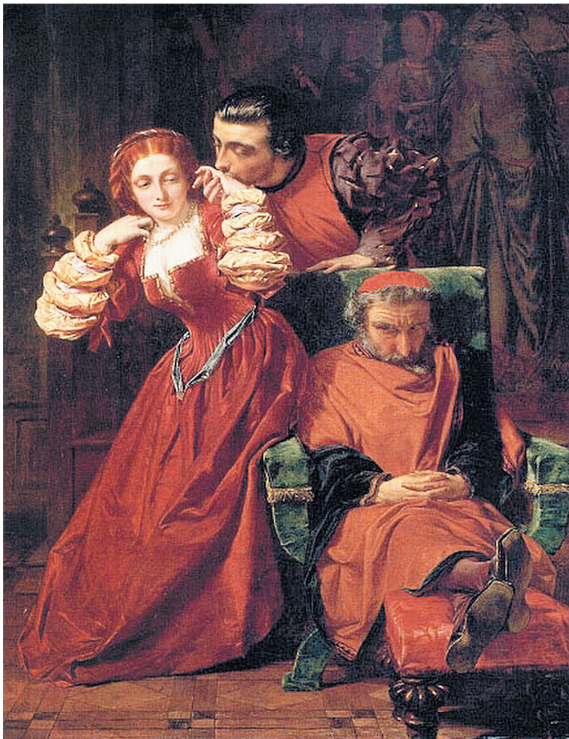
Альфред Элмор. Два веронца. 1857

Сильная британская проза, поэзия и театр значительно опережали развитие новаторских идей в изобразительном искусстве. Это привело к тому, что всему викторианскому искусству, и в том числе прерафаэлитизму оказались присущи литературность, привязка к тексту – словом, то, от чего в ужасе открещивались французские модернисты, настаивающие на самодостаточности визуального образа.