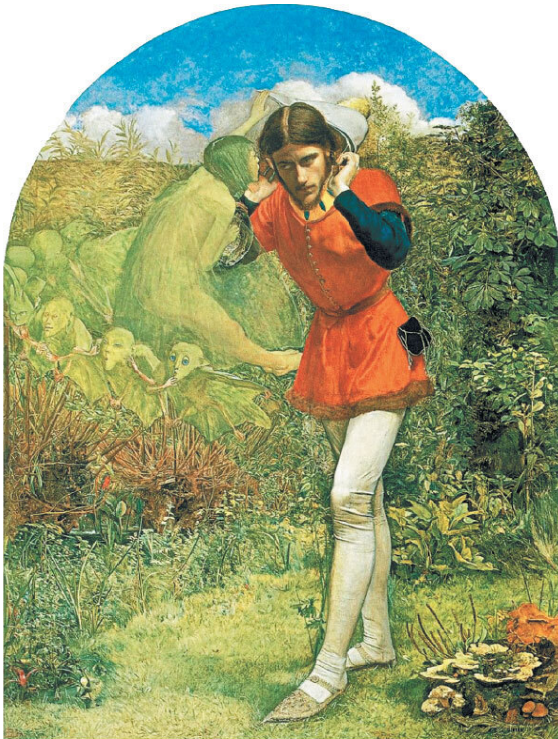
Джон Эверетт Милле. Фердинанд, соблазняемый Ариэлем. 1850

Легко узнаваемые сюжеты литературных произведений неизменно имели успех у публики. Как правило, художники избирали самые драматичные моменты шекспировских пьес. Так Альфред Элмор, работая над картиной на сюжет комедии « Два веронца » запечатлел первую сцену третьего акта, в которой герцог Миланский догадывается о любви своей дочери Сильвии к молодому дворянину Валентину: