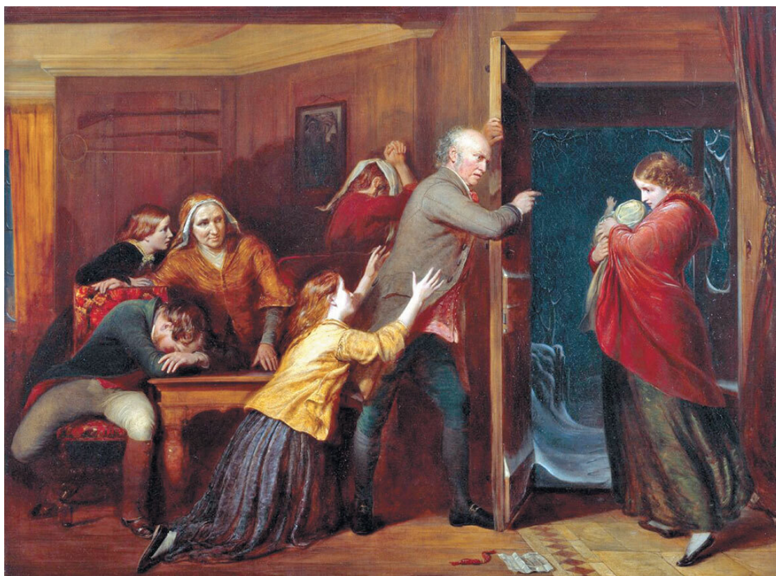
Ричард Редгрейв. Изгнанная. 1851

Драматизм сцены усиливают брошенные на пол кошельки с деньгами – викторианская вязаная монетница – и обличительное письмо, гравюра с изображением изгнания Агари на стене, буря, бушующая за дверью и протянутые в мольбе руки девушки. Возможно, прообразом героини этого произведения стала родная сестра Редгрейва, которой было отказано от дома. Девушка, вынужденная работать гувернанткой, быстро угасла и умерла в 1829 году.