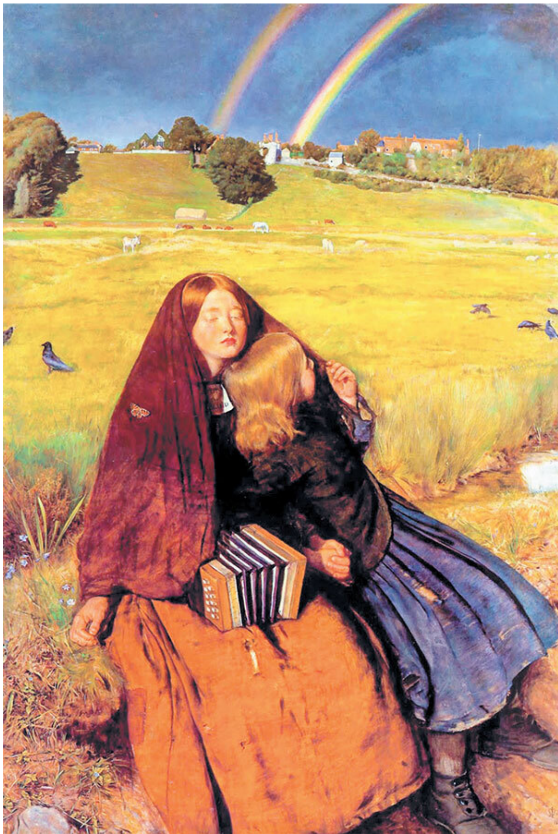
Джон Эверетт Милле. Слепая девочка. 1856

Викторианское общество предпочитало идиллические полотна и дидактические сюжеты, однако находились авторы, которые довольно точно фиксировали и подлинные реалии повседневной жизни. Жанровая живопись стала самым ярким явлением викторианского искусства.