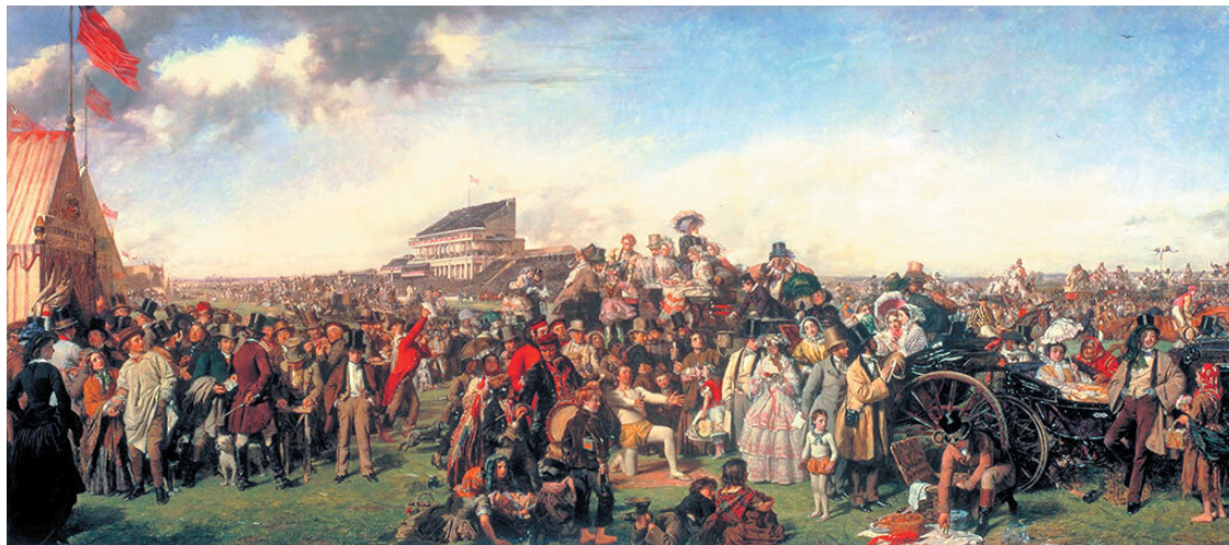
Уильям Пайелл Фрит. День дерби. 1858