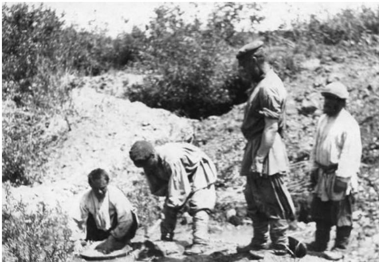
Старатели за работой. 1902 г.

боты в случае несоблюдения ими его указаний.