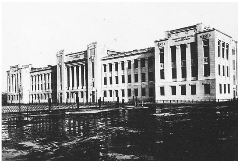
Городской народный Университет имени А. Шанявского на Миусской пл. 1912 г.