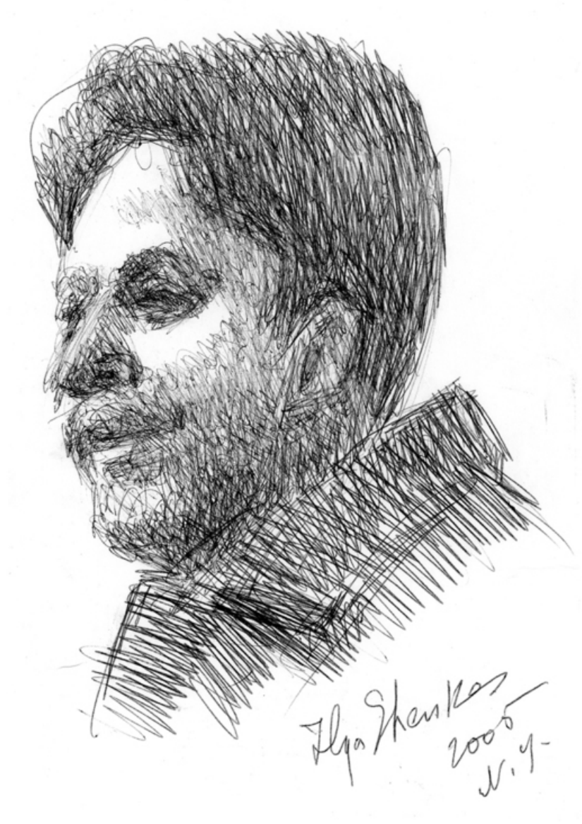
© Илья Шенкер, портрет Михаила Мазеля, 2005