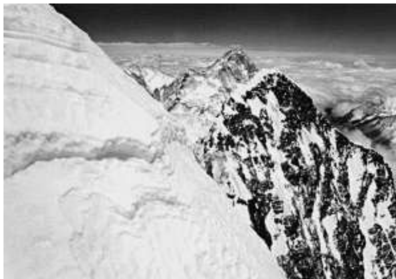
Лхоцзе Шар. Вид с Лхоцзе Средней

Несколько попыток достижения этой вершины оказались безуспешными.