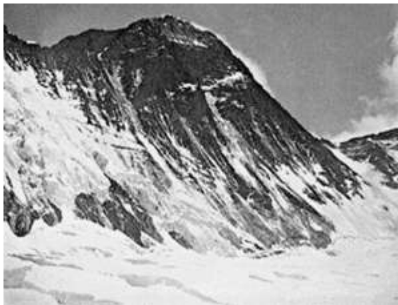
Южный склон Джомолунгмы (Эвереста)

С юга Джомолунгма почти не видна, т. к. круто обрывается к леднику Кхумбу. Над хребтами возвышается только ее вершина. Однако южный склон оказался наиболее доступным для восхождения. Первая экспедиция, покорившая эту вершину, поднялась именно по южному склону. Но даже и здесь людям пришлось предпринимать значительные усилия, чтобы подняться на Эверест. Успеху предшествовали целых 32 года неудач. За это время было сделано около 15 попыток, и все оказались неудачными. Наконец в 1953 году Эверест был покорен английской экспедицией под руководством полковника Джорджа Ханта. 29 мая двое из членов экспедиции – новозеландец Эдмунд Хиллари и шерп Тенцинг Норгей – достигли высоты 8848 м (наивысшей точки земного шара).