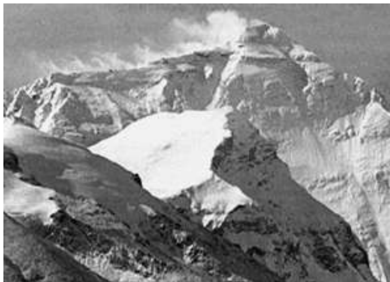
Северный склон Джомолунгмы (Эвереста)