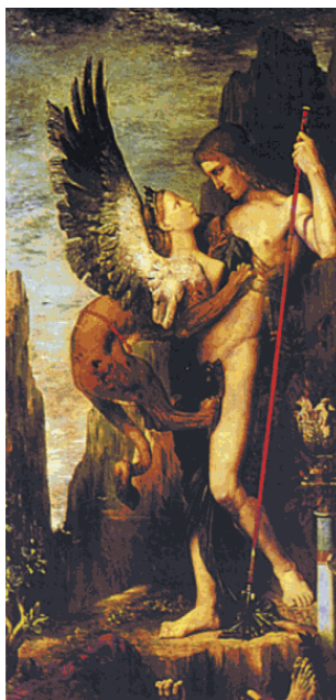
Г. Моро. «Эдип и Сфинкс»

Наиболее древними, по всей вероятности, являются мифы, объясняющие те или иные признаки животных. Тогда же родились мифы, рассказывающие о происхождении животных от людей, а также и о противоположной точке зрения: о том, что люди прежде были животными. Связаны с ними мифы о превращении людей в животных или растения. Кроме того, в мифах рассказывается о сотворении небесных тел неземными, сверхъестественными существами. Космологические мифы также относятся к одним из самых древних. В них выражались представления древних о происхождении Вселенной. Особое место занимали антропогонические мифы, рассказывающие о происхождении человека. Как правило, во всех космологических и антропогонических мифах присутствуют две основные идеи: сотворение и развитие. Первоначально мир создается сверхъестественным существом (богом, демиургом, колдуном, волшебником) либо возникает из какого-то первобытного существования, хаоса, вечной ночи, яйца и др. Далее, как правило, рассказывается о происхождении богов и людей или только людей. В таких мифах можно обнаружить сведения о чудесном рождении, о судьбе, о происхождении смерти, о загробном мире, а также мифы-пророчества о конце мира, гибели всего живого.