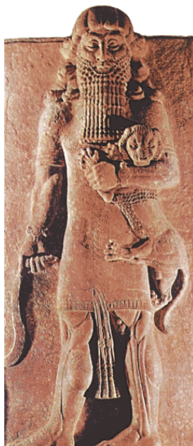
«Гильгамеш со львом»

Другой герой, Сосруко, относящийся не к карело-финскому, а к нартскому эпосу, также совершил подвиг культурного героя – добыл огонь. Он же смог вырастить фруктовые деревья в местности, где жил сам.