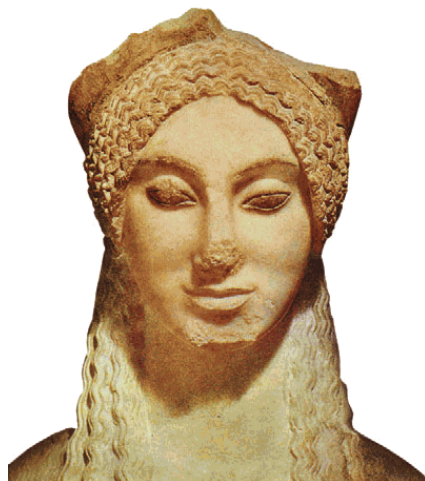
Голова коры (Персефоны). Деталь статуи с афинского Акрополя

Исследователи постарались выяснить, был ли миф сочинен в обоснование обряда или, наоборот, обряд возник на основе уже существующего мифа. Известно, что обряд является самой устойчивой частью религии, в то время как мифологические представления нестойкие, часто изменяются, иногда и вовсе забываются. Их заменяют новые мифы, объясняющие значение обряда, возможно уже с искаженным смыслом.