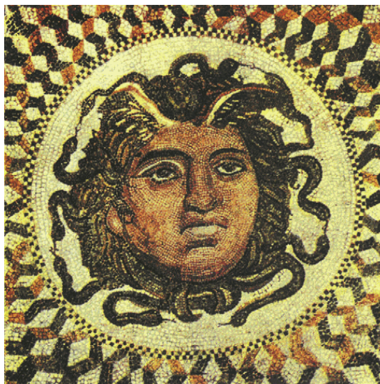
«Медуза». Деталь мозаики из Тины

Наиболее часто мотивы борьбы с чудовищами встречаются в мифах народов Полинезии и Микронезии, у северо-восточных палеоазиатов, обских угров и др. Но их можно обнаружить и в мифах других народов, например у греков. С чудовищами приходилось сражаться Гераклу, Персею, Тесею, Ясону, Одиссею и многим другим.