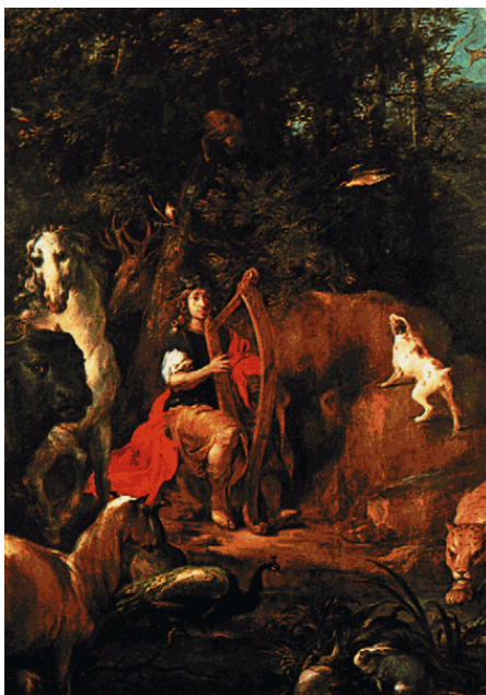
В. Рейнер. «Орфей с животными»

В книге также рассказывается о героических китайцах, которые добывали огонь, основывали города, боролись с наводнениями; о корейских правителях божественного происхождения; о ста братьях нартах и их единственной сестре, красавице Гудрун и матери Сатане.