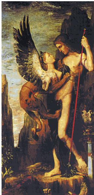
Г. Моро. «Эдип и Сфинкс»

Наиболее древними, по всей вероятности, являются мифы, объясняющие те или иные признаки животных. Тогда же родились мифы, рассказывающие о происхождении животных от людей, а также и о противоположной точке зрения: о том, что люди прежде были животными. Связаны с ними мифы о превращении людей в животных или растения. Кроме того, в мифах рассказывается о сотворении небесных тел неземными, сверхъестественными существами. Космологи-