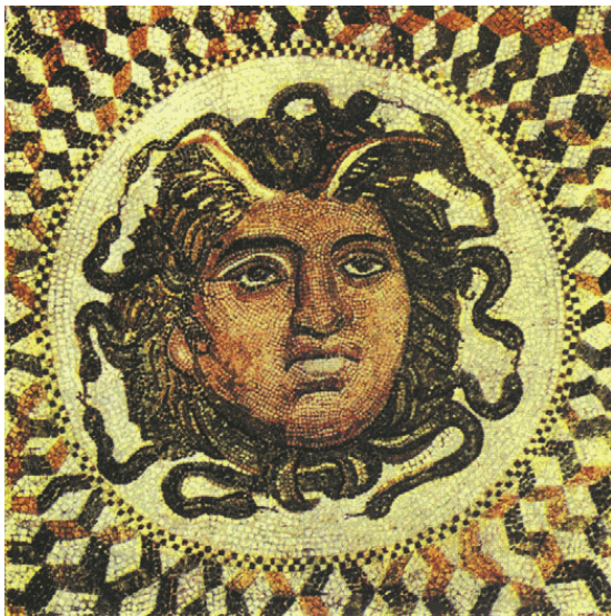
«Медуза». Деталь мозаики из Тины

устройства жизни людей, культурным героям приписывают также возможность бороться со стихийными хаотическими природными силами, которые описываются в мифе как чудовища, великаны, демоны и подобные им персонажи. Часто, сражаясь с чудовищами, культурные герои спасают жителей города или другого поселения и таким образом предотвращают человеческие жертвы, которые могли случиться в будущем.