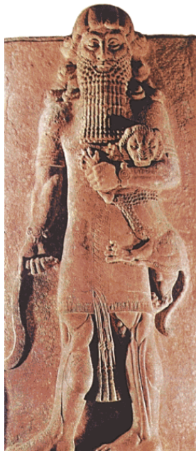
«Гильгамеш со львом»

му, а к нартскому эпосу, также совершил подвиг культурного героя – добыл огонь. Он же смог вырастить фруктовые деревья в местности, где жил сам.