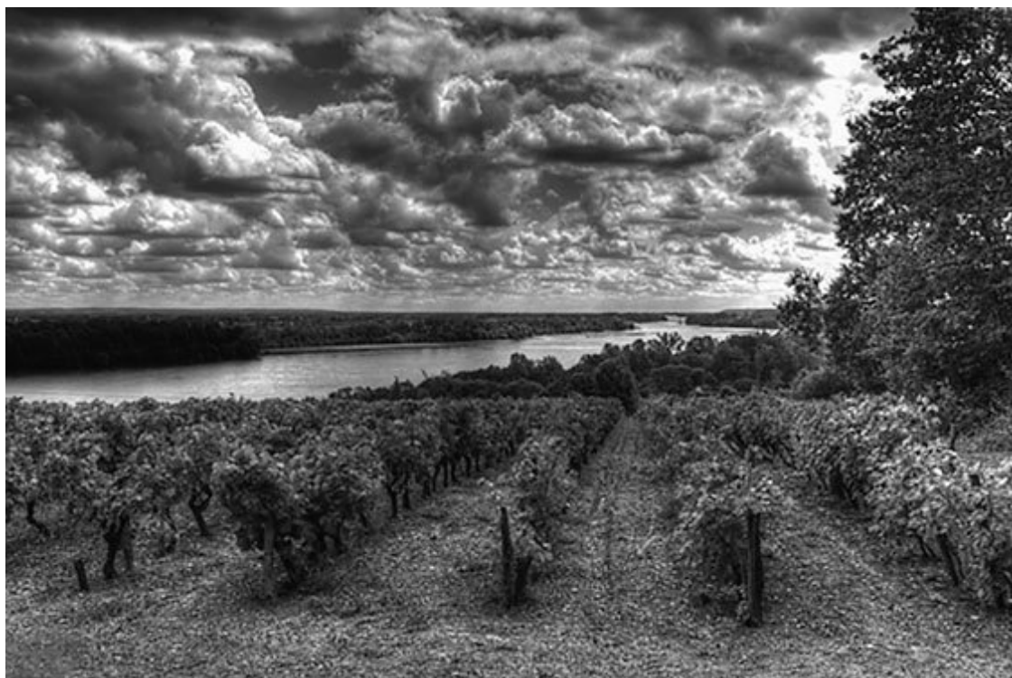
Виноградники на берегах Луары

Ни в одном другом месте Западной Европы не существует такого огромного количества замков, сосредоточенных на относительно небольшой территории. Большинство из них, возведенных с XI по XVIII столетие, до сих пор прекрасно сохранились и так замечательно гармонируют с окружающей их пышной природой, что невольно заставляют вывести формулу идеальной красоты: это исключительная выверенность архитектурных форм, а именно сочетание изящества и простоты, а также абсолютное единение творения человека и пейзажа.