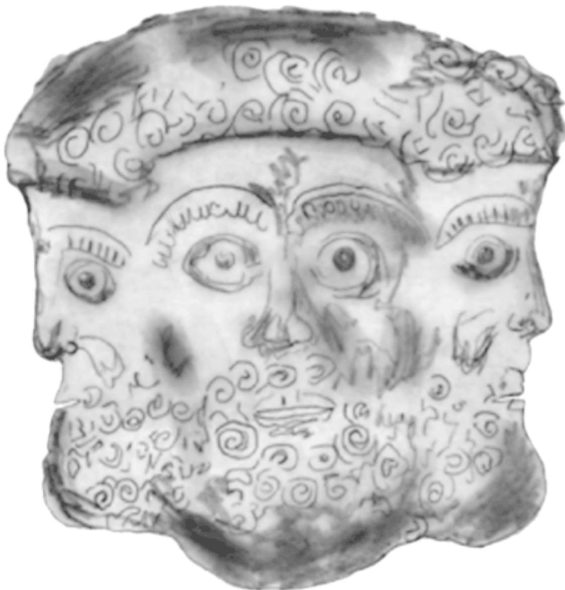
Древняя маска бога Люга

Люга всегда сопровождает птица, как и греческую богиню-воительницу Афины – сова. Это ворон, который в древности назывался так же, как и его хозяин, то есть Люг, или Лу. Исследователь кельтской истории Марсель Моро писал: «Он – создатель и преобразователь. Это он в своем клюве вынес ил из глубины вод на поверхность, и Бог создал для людей землю. Ворон – божество грома, дождя и бури, заставляющее сиять свет и устраивающее жизнь в потустороннем мире. Он научил людей разводить огонь, охотиться, ловить рыбу, он защищает от злых духов». Кроме того, как известно, ворон пожирает мертвечину, но от этого его магическая сущность не меняется.