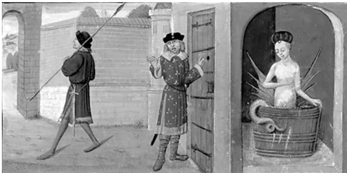
Обнаружение тайны Мелюзины. Художник Гиллебер де Мец

Однако осталась великая река Луара, на берегах которой на протяжении столетий вершились судьбы Франции. Подобно огромному ножу, она рассекает пространство от Центрального плоскогорья, вбирая в себя притоки, к Орлеану. А оттуда устремляется на запад, впадая в Бискайский залив, сливаясь с Атлантическим океаном. Эта река, означающая для Франции то же, что Волга для России или Ганг для Индии, неторопливо несет свои обычно спокойные воды, незримо связывая исторические времена и судьбы людей.