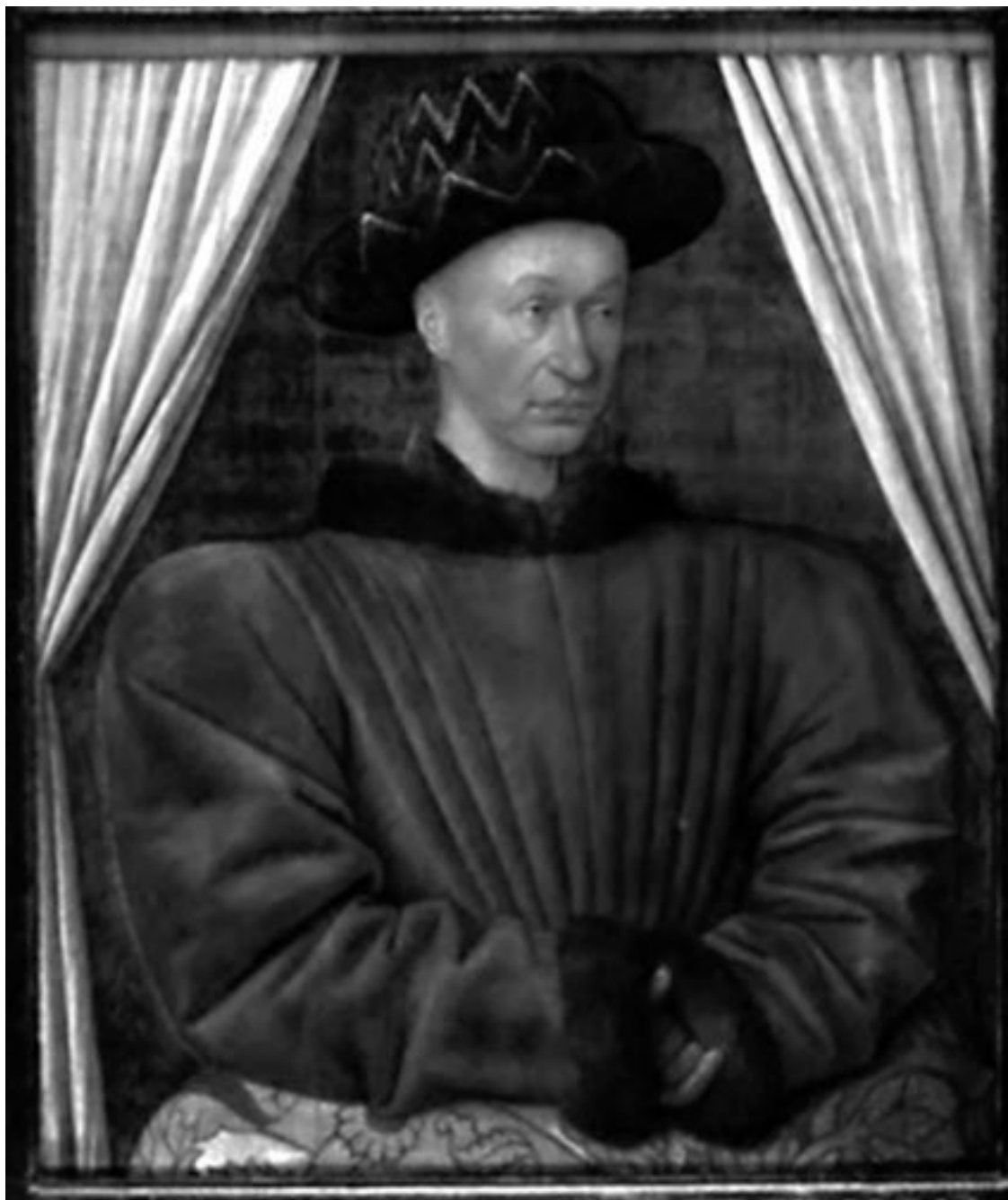
Портрет Карла VII, короля Франции. Художник Ж. Фуке

Король Карл VII жил в своих замках на Луаре вместе с относительно небольшим штатом приближенных, который ограничивался советниками, клириками и, разумеется, прекрасными дамами. Король привык рано подниматься утром. Церемониал требовал ежедневно выслушивать по три мессы. Карл обязательно исповедовался и молился. После этого он отправлялся на прогулку по окрестностям на лучшем рысаке из своей конюшни, а уже затем, вернувшись в королевские покои, начинал давать аудиенции.