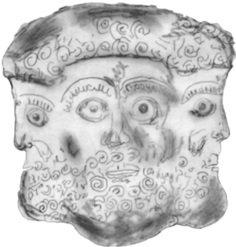
Древняя маска бога Люга