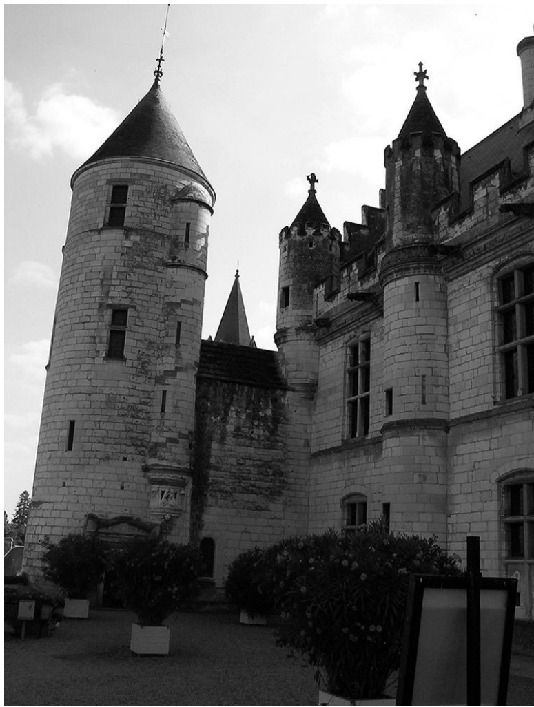
Башня Прекрасной Аньес