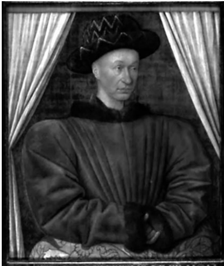
Портрет Карла VII, короля Франции. Художник Ж. Фуке