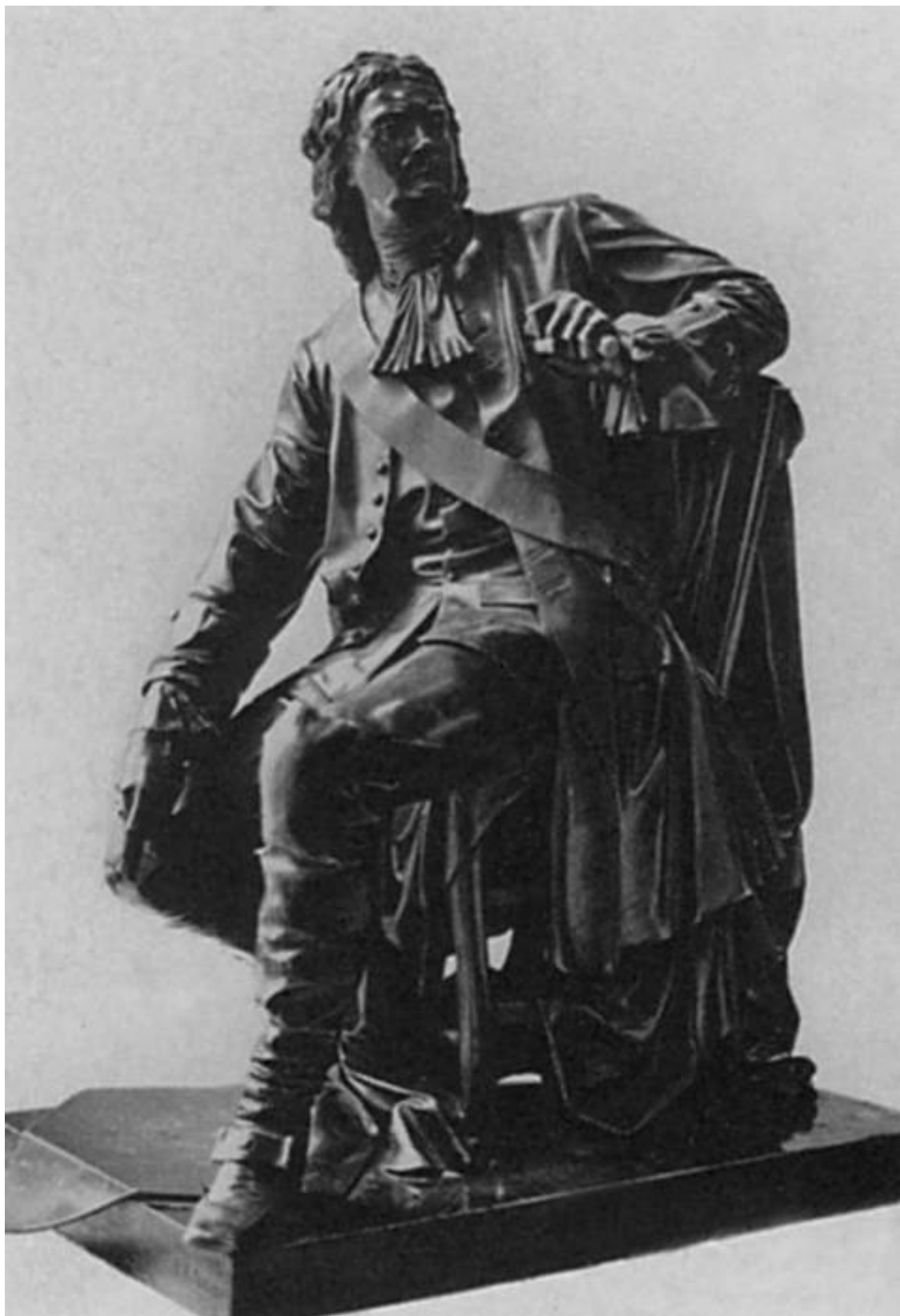
А. М. Опекушин. Петр I

Как никогда было важно скорее завершить сооружение форта, гавани и складов для флота, поэтому Петру приходилось часто бывать на Котлине. Однако путешествие по неспо-