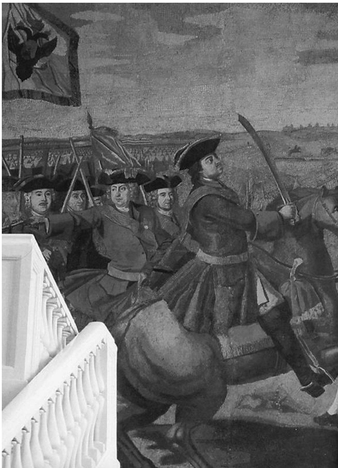
М. В. Ломоносов. Полтавская битва. Фрагмент