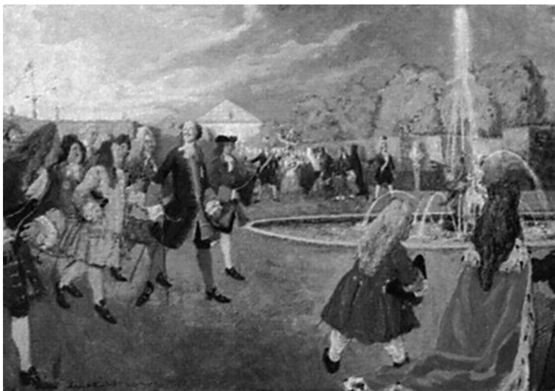
А. Н. Бенуа. Петр I на прогулке

Царь выдвинул план благоустройства территории Финского залива, по которому все побережье от Петербурга до деревни Красная Горка было разбито на одинаковые участки, отведенные для загородных резиденций знатных сановников.