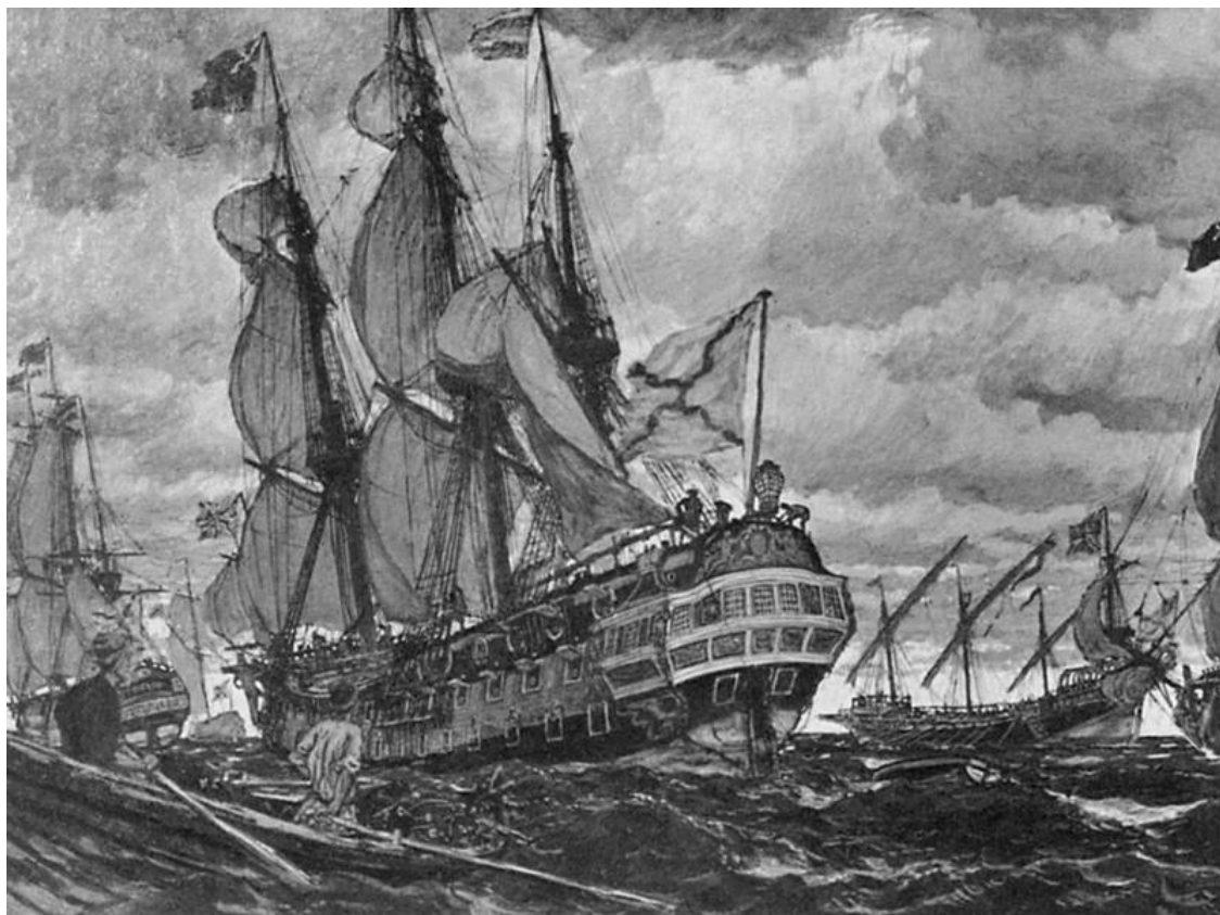
Е. Е. Лансере. Корабли времен Петра I

Произведения искусства Петровской эпохи отражали прежде всего подъем национального и патриотического самосознания. Самым величественным и в высшей степени изысканным памятником того времени стал Петергоф, символизирующий победу русского народа в Северной войне.