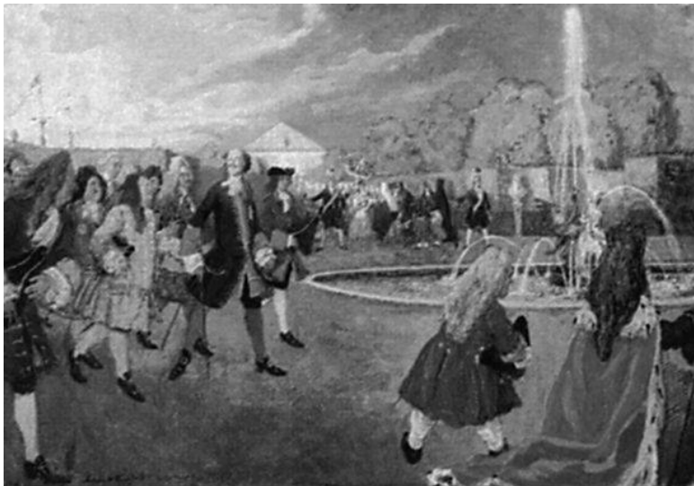
А. Н. Бенуа. Петр I на прогулке

Участки были в виде полос длиной 1000 саженей и шириной 100 саженей. Границей застройки стала грунтовая дорога на юге (Петергофская перспектива). Южнее этой дороги всякое строительство запрещалось, поскольку там находились места «заповедных лесных рощ», предназначенных для охот и зверинцев.