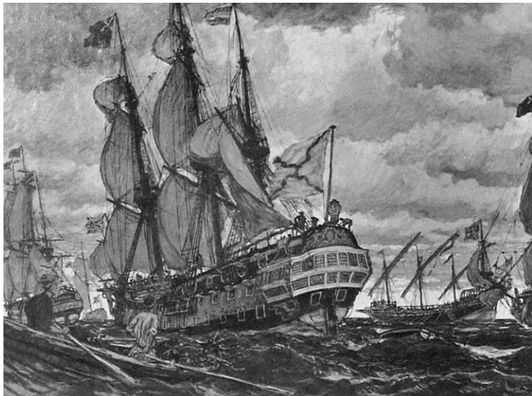
Е. Е. Лансере. Корабли времен Петра I

городских и загородных домов. Во время застройки столицы в полной мере проявили свой талант такие знаменитые русские зодчие, как И. Коробов, Т. Усов, И. Устинов, М. Земцов, И. Мордвинов, П. Еропкин.