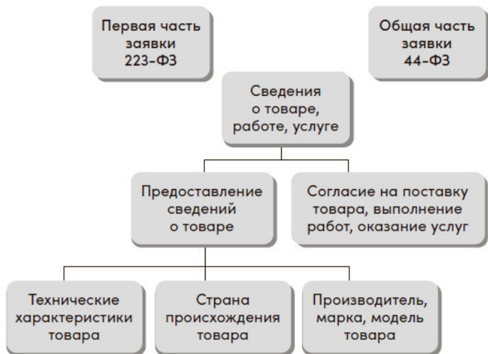
Рис. 4.2. Предоставление сведений о товаре, работе, услуге

Далее рассмотрим непосредственно заполнение сведений о поставляемом товаре. Чаще всего требования к товару устанавливаются в виде неконкретных значений показателей с указанием слов и словосочетаний «не более», «не менее», «от», «до», «более», «менее», «и», «или», «в диапазоне» и знаков»,», «;» и других. При этом закупочная документация содержит в себе инструкцию по заполнению показателей, где, например, знак»,» будет означать «и», а знак «;» будет означать «или». Участнику закупки при заполнении сведений о товаре необходимо прежде всего внимательно изу-