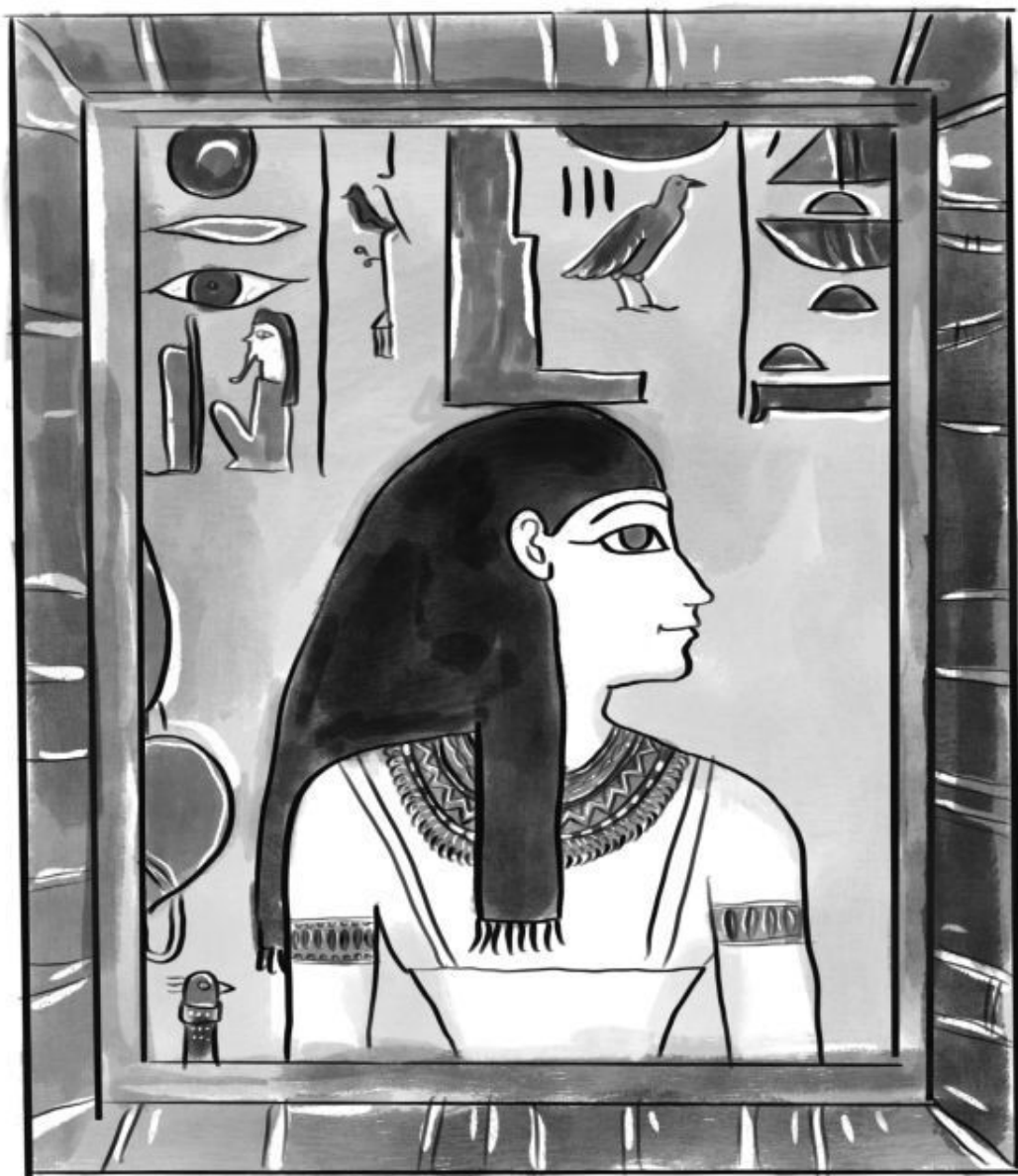
Богиня Месхенет с кирпичом вместо головного убора

Как и первобытные предшественницы, рожать египтянки предпочитали вдали от семьи, использовали для этого отдельную хижину или павильон. В обеспеченных или царских семьях стены павильона расписывали изображениями различных богов, которые должны были уберечь женщину и малыша от несчастий. Рядом с роженицей ставили статуэтку богини Таурт, покровительницы женщин и детей. Предполагалось, что она обеспечит легкие роды. Таурт изображалась в виде стоящей беременной самки гиппопотама, с женскими руками и грудью и задними львиными лапами (также иногда и головой львицы). Безграничная ярость гиппопотама, защищающего своего детеныша, символизировала всепоглощающую и всепрощающую материнскую любовь. Помимо Таурт, с родами связывали богиню Месхенет. Она, по сути, являлась олицетворением кирпичей, на которых рожала египтянка (вот почему иногда Месхенет представляют с кирпичом вместо головного убора или в виде кирпича с головой женщины).