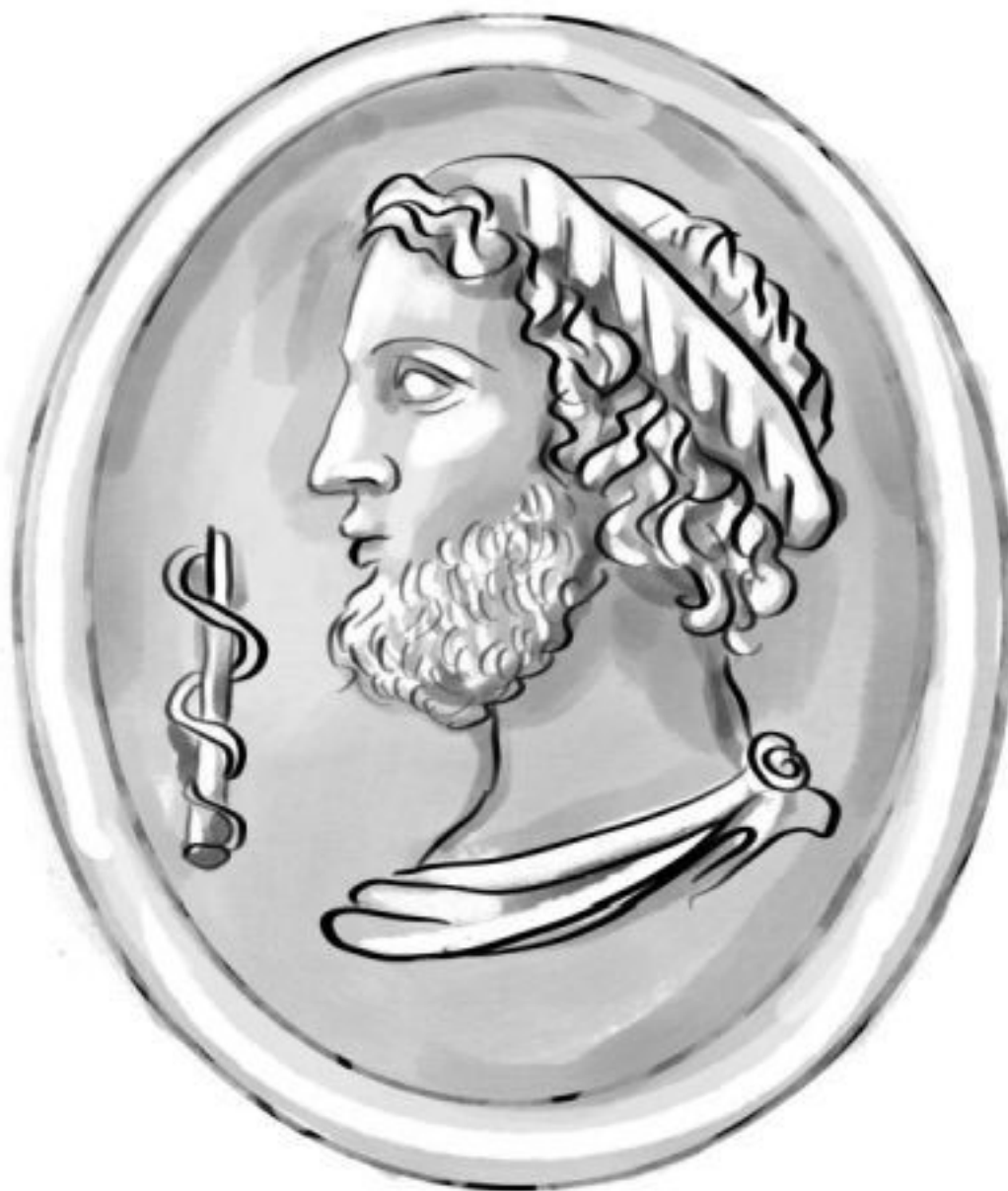
Асклепий – бог медицины и врачевания

Центрами медицины в Древней Греции были храмы, посвященные богу Асклепию. В Триkke, Эпидавре, на острове Кос всего насчитывалось около 300 храмов. Асклепий почитался как покровитель медицины и врачевания. Существует несколько версий мифа, описывающих рождение бога врачевания.