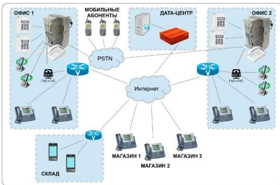
Схема сети может быть следующей:

Аналоговые станции подключены к FSO/FXS-шлюзам, которые в свою очередь подключены к Elastix через Интернет. Для аналоговых станций FXS-шлюзы выглядят как городские линии, а FXO-шлюзы заменяют аналоговых абонентов. В случае подключения шлюзов к Elastix все наоборот – линии FXS подключаются как SIP-телефоны, а FXO – как линии оператора связи (транки/Trunks). Это позволяет организовать двустороннюю интеграцию аналоговых станций и Elastix, что дает возможность переводить на VoIP сотрудников и подключения к операторам постепенно. Сначала можно переключить пару отделов на Elastix, переадресовав на старой станции их номера на новые, а на Elastix настроить для них виртуальные номера (Virtual Extension) с прежней нумерацией, переадресовав (FollowMe) на их фактические новые номера. Чтобы такая переадресация сработала, обычно необходимо на старой АТС