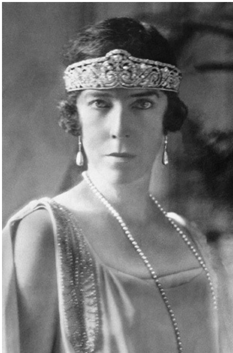
Королева Бельгии Елизавета в тиаре 1910 года из платины с бриллиантами