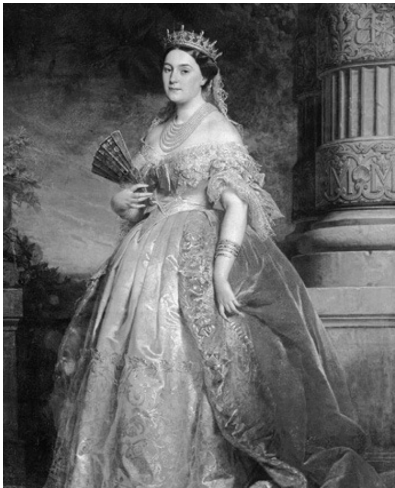
Луи-Франсуа Картье и его самая важная клиентка первых лет – принцесса Матильда Бонапарт. Она не только по-