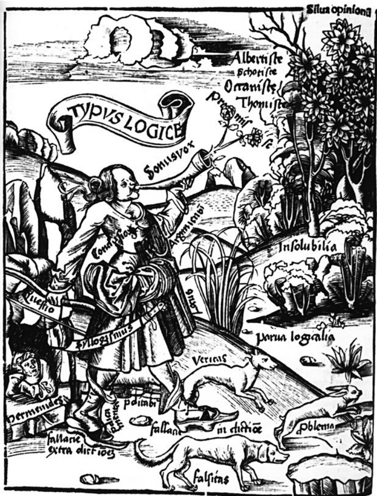
Грегор Рейш. Margarita Philosophica, 1503. Две собаки