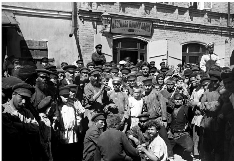
У казенной винной лавки в Нижнем Новгороде

В обществе считалось, что русский народ пьет безбожно, и вина за это, как уже было сказано, многими возлагалась на правительство. Однако статистика этого не подтверждает. К 1913 году потребление алкоголя на душу населения в год составляло около 3 литров, и Россия по этой позиции занимала предпоследнее место в десятке наиболее развитых стран. До английского рабочего русскому было далеко.