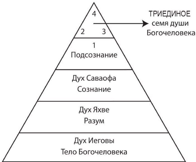
Рис. № 3. Духовная структура Богочеловека третьей расы

Особенность третьей расы земного человечества заключалась в том, что в духовно-телесной структуре их организмов нашлось место всей троичной иерархии будущих высших вселенских духов Иеговы, Яхве и Саваофа. В то же время семена человеческой души представлены исключительно нетварными духами высших божественных иерархий чет-