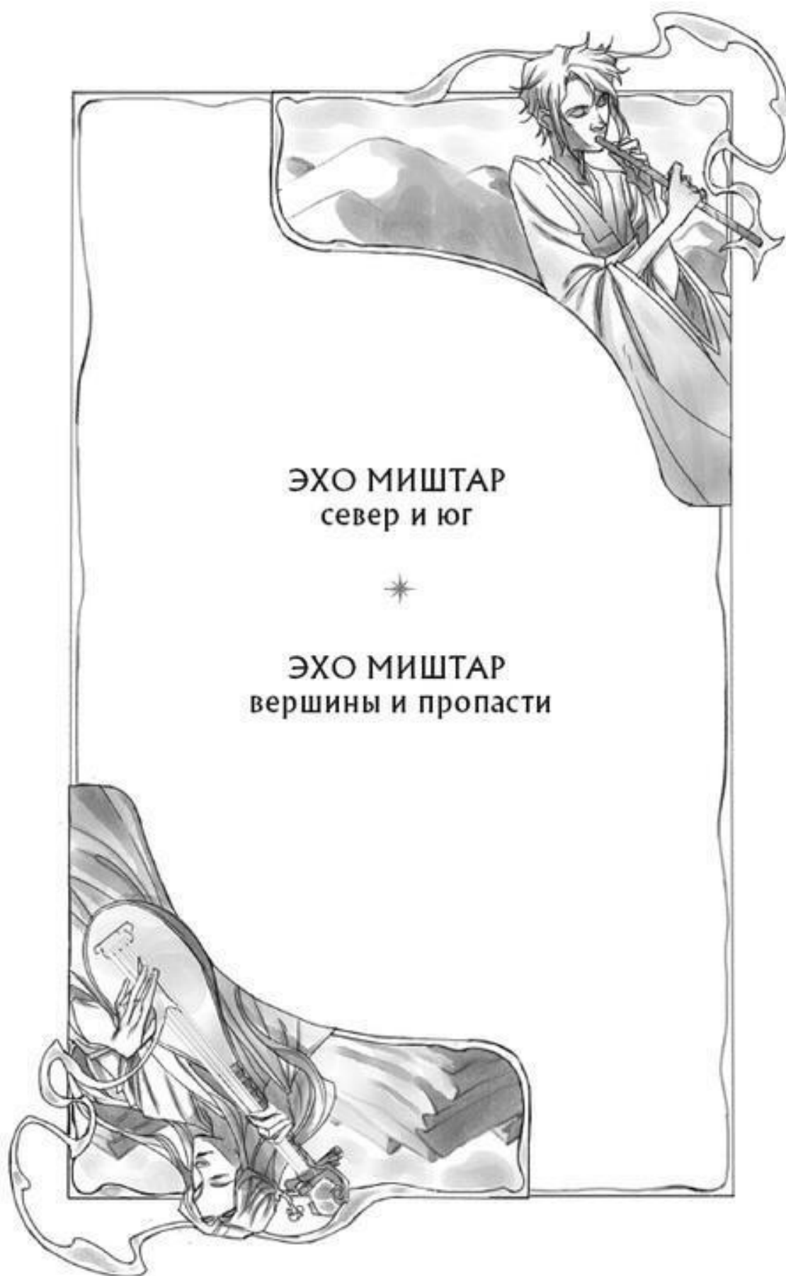
Иллюстрации на обложке и в блоке Илоны Шавлоховой