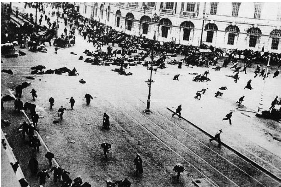
4 июля 1917 г. Расстрел рабочей демонстрации на Невском проспекте.

Спрашивается, зачем Александр Федорович начал заигрывать с военными, всячески одобряя их намерения к решительным действиям? Керенский стал заложником ситуации, при которой самой влиятельной политической силой в столице стали солдаты петроградского гарнизона. Двести тысяч вооруженных и обнаглевших от вседозволенности молодцов в солдатских шинелях категорически не желали отправляться на фронт и любые попытки правительства вернуть их к дисциплине и порядку могли кончиться для «временных» министров самым печальным образом. Солдатская масса, подпавшая под влияние большевистской агитации, стала настоящей бомбой, грозившей взорваться в любой момент. Поэтому в правительстве вызрел план «разгрузить» Петроград от разложившейся солдатской массы, отправив полки на фронт воевать за победу революции, но сделать это руками самих военных.