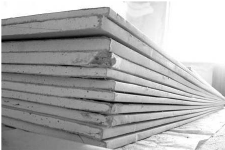
Рис. 1.1. Гипсокартон

Для потребителя также самым важным плюсом является способность гипсокартона пропускать воздух, одновременно поддерживая в помещении ровный режим влажности. Вне сомнений и функциональная экологичность гипса. Этот материал не содержит токсичных веществ и напрочь лишен какого бы то ни было запаха.