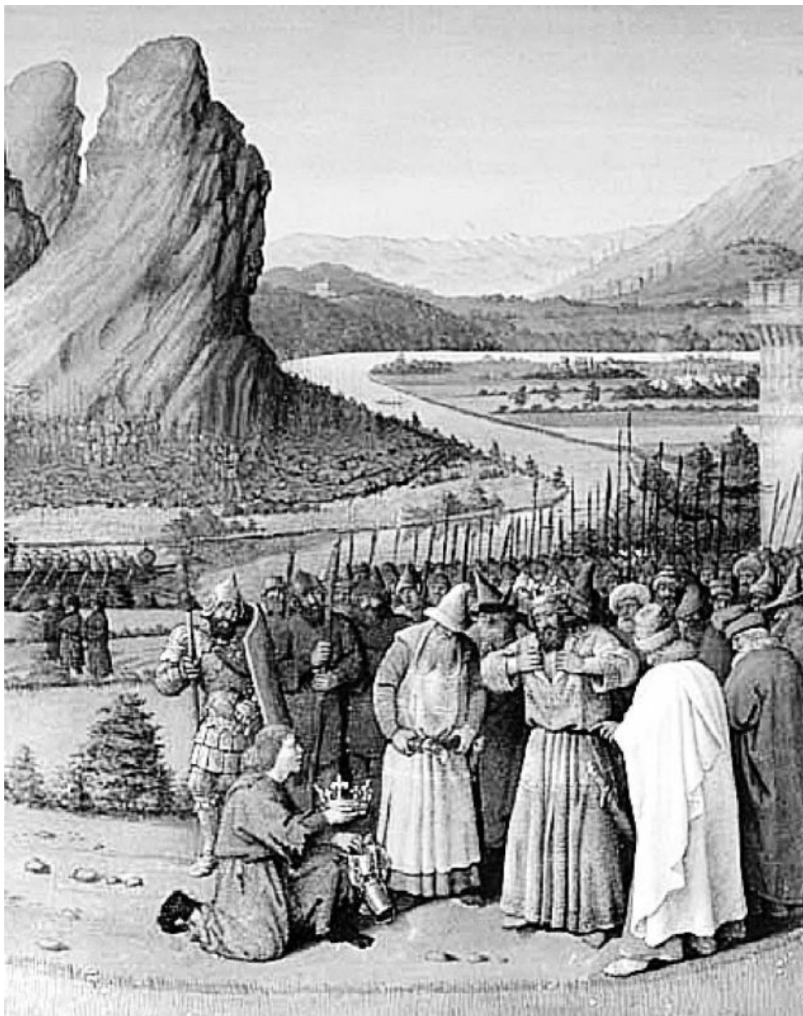
Жан Фуке. Давиду приносят новость о смерти Саула. Миниатюра из рукописи «Иудейских древностей» Иосифа Флавия. 1470 г.

Провел Давид и внутренние реформы, которые вовсе не понравились его подданным. Например, он ввел строгий царский суд. Но ведь еще были живы традиции военной демократии, и старейшины хотели судить сами.