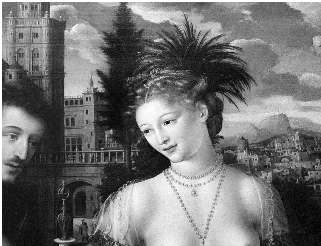
Ян Массейс. Давид и Вирсавия. 1562 г.

Давид был сильным и умным правителем. Но безгрешным человеком его никак не назовешь. Один из самых недостойных его поступков – он соблазнил Вирсавию – жену военачальника Урии. Увидел ее купающейся, был потрясен ее красотой. По некоторым данным, у него и так было уже около десяти жен и десяти наложниц. Но Вирсавия его покорила. Она ждала ребенка от Давида, когда вернулся с войны Урия и, прослышав, что случилось, отказался войти в свой дом. Давид прогневался и велел отправить Урию обратно на войну, причем в такие места, где он неминуемо погибнет. Так и произошло.