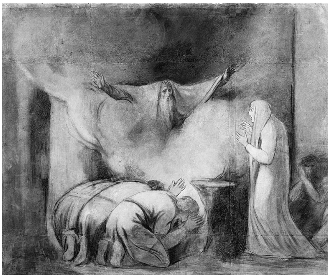
Джордж Ромни. Призрак Дария, являющийся Атоссе. Иллюстрация трагедии Эсхила «Персы»

Итак, Ксеркс начал с претензий на подлинное господство, желая превзойти своего великого отца Дария I. Но для этого надо было торопиться. И ему ничего не оставалось, как двинуться на Запад.