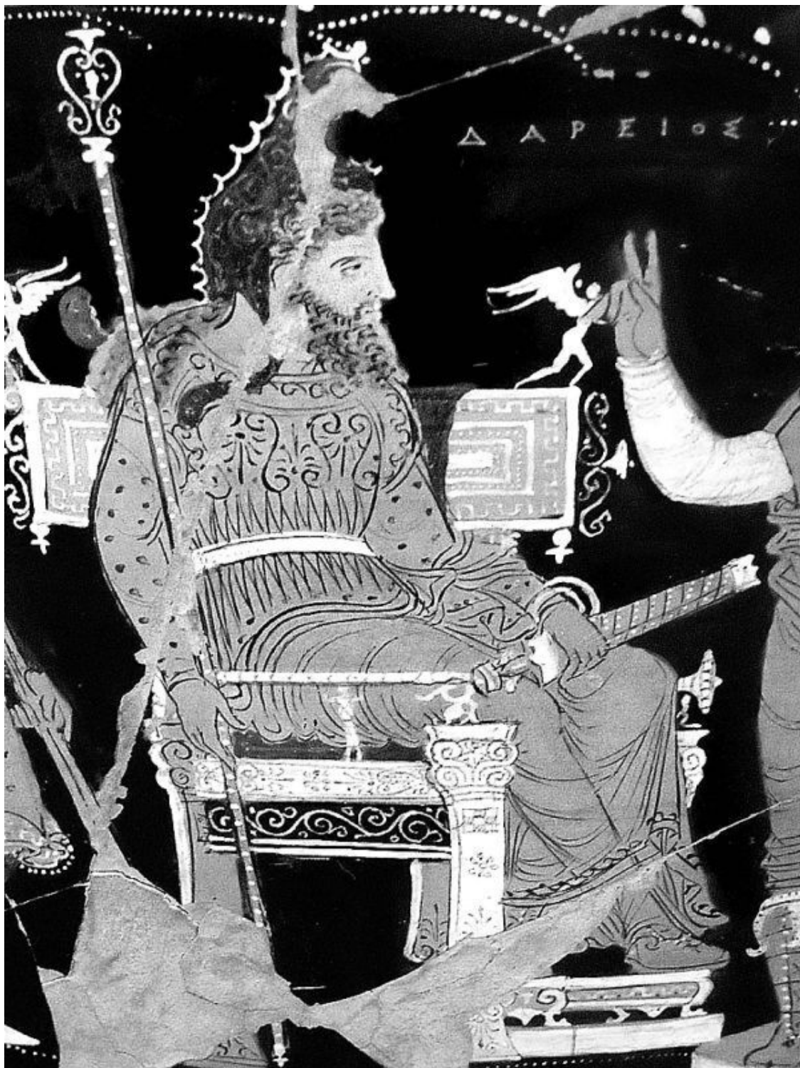
«Ваза Дария». Ок. 340–320 гг. Археологический музей Неаполя

Как Дарий пришел к мысли о том, что Ксеркс должен унаследовать трон? На эту мысль его, вероятно, навело то, что он родился, когда Дарий уже был царем.