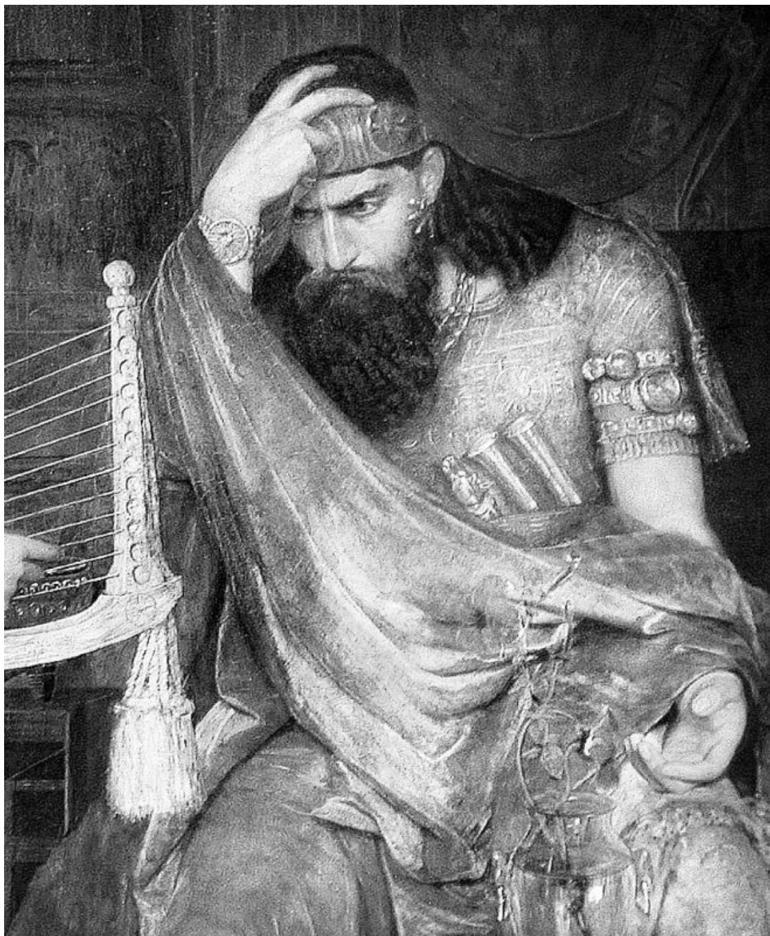
Эрнст Йосефсон. Саул внемлет музыке Давида. Фрагмент

У юного воина была сумка, а в ней пять гладких камней из ручья. На плече – праща, в руке – посох. Библия передает презрительную реплику Голиафа: «Что ты идешь на меня с палкою? Разве я собака?» Давид раскрутил пращу, и камень пробил Голиафу череп. Потрясенное войско филистимлян разбежалось. Давид подошел к поверженному великану, взял его меч, отсек мертвому врагу голову и отнес ее в Иерусалим.