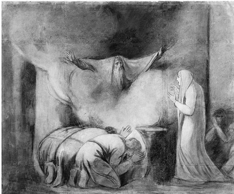
Джордж Ромни. Призрак Дария, являющийся Атоссе. Иллюстрация трагедии Эсхила «Персы»

Итак, Ксеркс начал с претензий на подлинное господство, желая превзойти своего великого отца Дария I. Но для этого надо было торопиться. И ему ничего не оставалось, как двинуться на Запад.