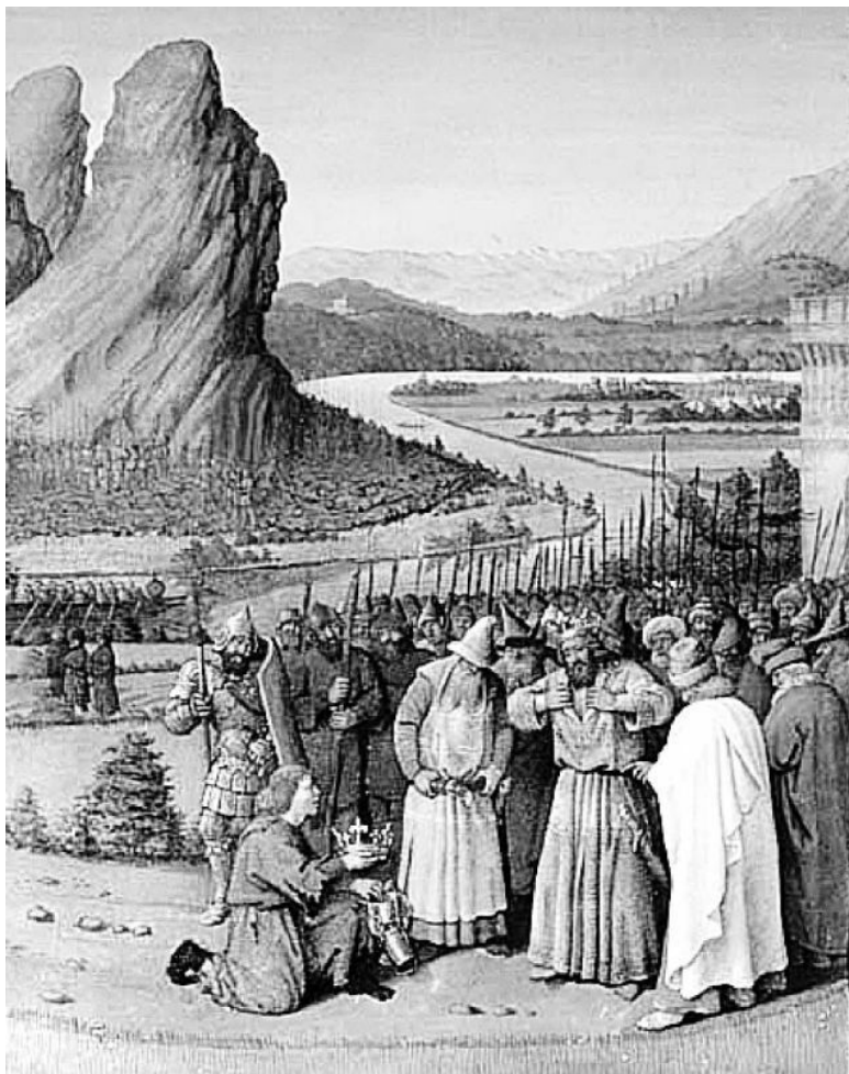
Жан Фуке. Давиду приносят новость о смерти Саула. Миниатюра из рукописи «Иудейских древностей» Иосифа Фла-