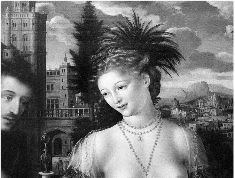
Ян Массейс. Давид и Вирсавия. 1562 г.

Но даже если не воспринимать буквально невероятные цифры, понятно, что Давид собрал огромные средства для сооружения храма. Он привлек в Иерусалим лучших каменотесов и других искусных мастеров. Это было политически правильно и, главное, дальновидно. Плоды усилий Давида стали очевидны уже в правление его сына, царя Соломона.