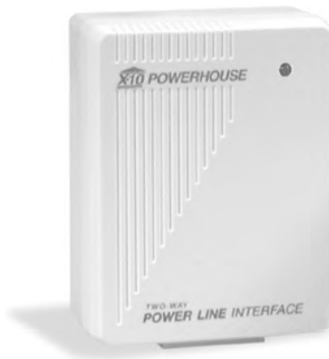
Рис. 1.2. Модуль двустороннего интерфейса

При подключении к компьютеру контроллеры и интерфейсы можно программировать. Для этого существует множество приложений – как платных, так и бесплатных.