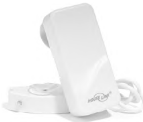
Рис. 1.7. Датчик утечки воды, посылающий беспроводной сигнал

□ датчики протечек и утечки газа (рис. 1.7) – для распознавания аварийной ситуации;