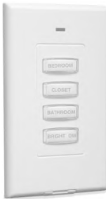
Рис. 1.10. Программируемый переключатель освещения X-10

X-10 не требует наличия центрального процессора: каждое устройство получает индивидуальный адрес, по которому его найдет отправленная с пульта команда. И все же центральный процессор не повредит. Если у вас есть компьютер, вы можете использовать его в качестве такого устройства. Для связи компьютера с модулями X-10 существуют специальные программы (рис. 1.11). Интересно, что все время включенным компьютер держать необязательно: модули и так запомнят и выполнят необходимые команды. Телефон также можно включить в систему. В таком случае отдавать команды и получать информацию можно будет, просто позвонив по телефону.