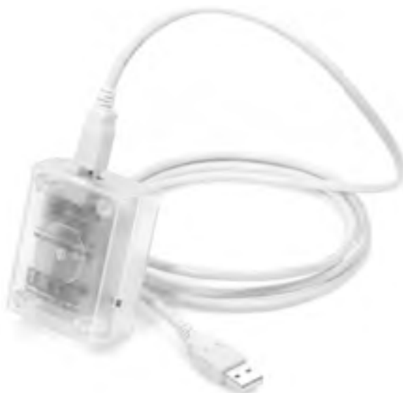
Рис. 1.6. USB-датчик температуры и влажности

□ датчики протечек и утечки газа (рис. 1.7) – для распознавания аварийной ситуации;