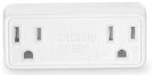
Рис. 1.3. Датчик температуры

□ датчики температуры (рис. 1.3) – для установления комфортного температурного режима в квартире;