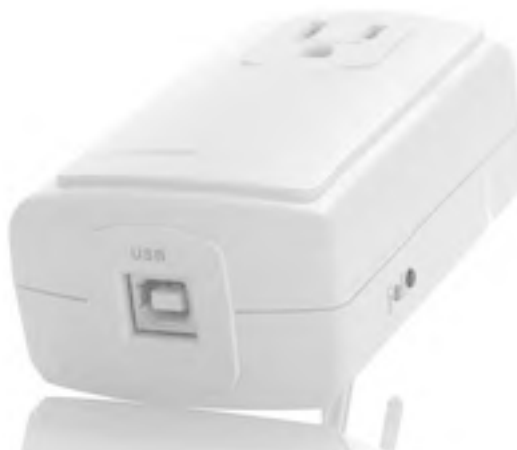
Рис. 1.1. Контроллер с таймером и внутренней памятью для работы без ПК

И те и другие находят своих покупателей: кому-то достаточно того, чтобы гардины по утрам закрывались, а кому-то нужно, чтобы и кофеварка включилась вовремя, и глазок зарегистрировал звонящего в дверь. Да и фирма-производитель тоже имеет значение: наиболее известные фирмы, разрабатывающие оборудование для «умного дома», – X10, INSYTE Electronics, York, Smarthome, Leviton, Speakercraft, NuVo, Middle Atlantic, Visonic, Applied Digital (Ocelot, Leopard) и др. Конечно же, и по стоимости эти устройства значительно различаются.