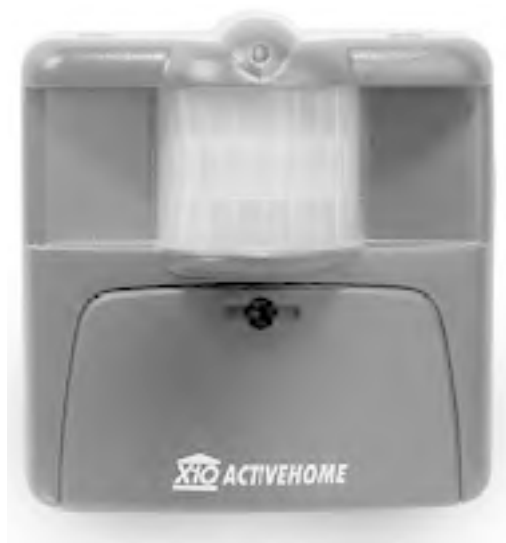
Рис. 1.5. Беспроводной внешний датчик движения

□ датчики движения (рис. 1.5) – чтобы включать или выключать свет в прихожей, ванной, туалете, а также для распознавания движения у входной двери;