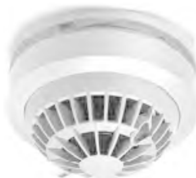
Рис. 1.8. Датчик дыма с передачей сигнала в случае аварийной ситуации

□ датчики дыма (рис. 1.8) – для включения вентиляции в помещении или для начала противопожарных действий.