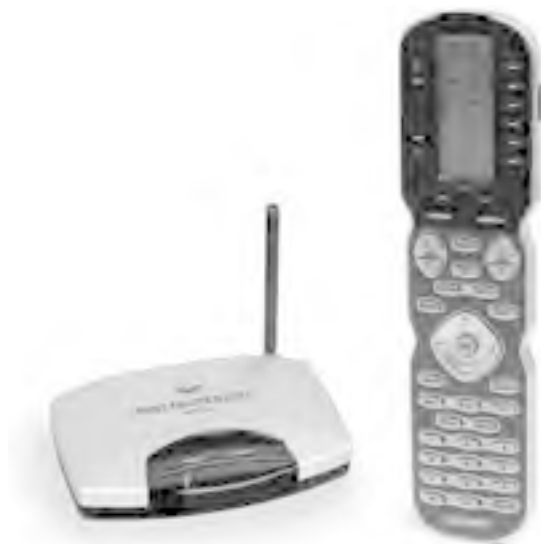
Рис. 1.9. Программируемый универсальный пульт управления, способный работать с 40 устройствами

Чтобы объединить всю вашу технику в единую сеть, не нужно тянуть все провода в один узел, паять грандиозные устройства или закупать дорогостоящее оборудование. Многие производители сегодня предлагают универсальные пульты управления (рис. 1.9).