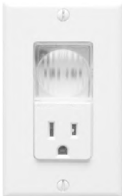
Рис. 1.4. Датчик освещенности

□ датчики движения (рис. 1.5) – чтобы включать или выключать свет в прихожей, ванной, туалете, а также для распознавания движения у входной двери;