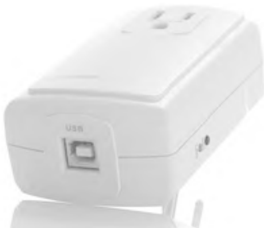
Рис. 1.1. Контроллер с таймером и внутренней памятью для работы без ПК

гут быть простыми, с минимальным количеством возможных сценариев, и более сложными, с энергонезависимой памятью, датчиками (что зачастую гораздо удобнее, чем покупка датчиков влажности, освещения, движения или температуры отдельно), разным количеством подключаемой техники и сенсорным дисплеем.