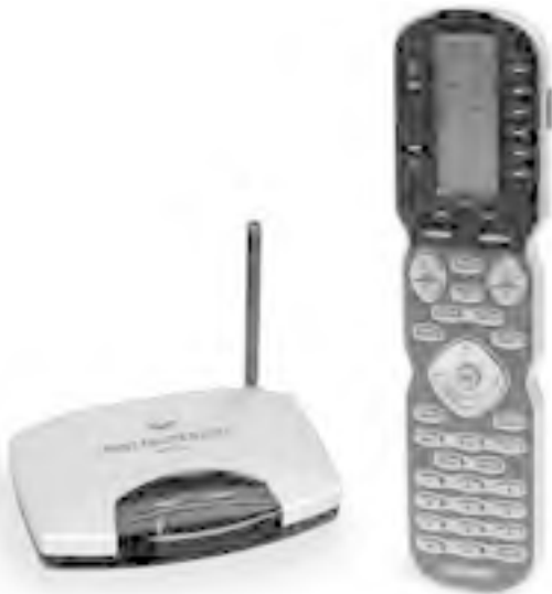
Рис. 1.9. Программируемый универсальный пульт управления, способный работать с 40 устройствами

Универсальные – потому что управлять они позволяют практически всей имеющейся в доме аппаратурой. И даже не только той, что есть, а и той, которую вы только планируете приобретать. А если такой универсальный пульт не знает, как себя вести со слишком уж устаревшим прибором или самодельной техникой, его всегда можно «натренировать» вести себя так, как нужно вам. В дальнейшем универсальный пульт сможет управлять и аудио-, и видеотехникой, и освещением, и жалюзи, и вообще всем, что включается в розетку