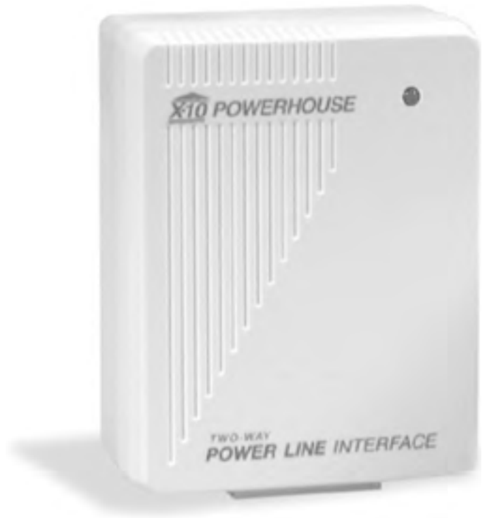
Рис. 1.2. Модуль двустороннего интерфейса

При подключении к компьютеру контроллеры и интерфейсы можно программировать. Для этого существует множество приложений – как платных, так и бесплатных.