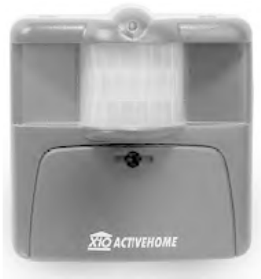
Рис. 1.5. Беспроводной внешний датчик движения

□ датчики влажности (рис. 1.6) – для настройки полива газонов в зависимости от погоды, для включения вентилятора в ванной комнате;