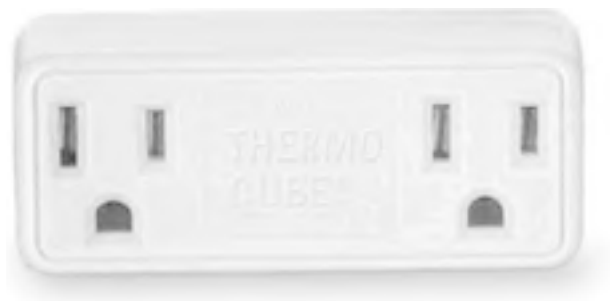
Рис. 1.3. Датчик температуры

□ датчики температуры (рис. 1.3) – для установления комфортного температурного режима в квартире;