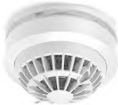
Рис. 1.8. Датчик дыма с передачей сигнала в случае аварийной ситуации

Чтобы объединить всю вашу технику в единую сеть, не нужно тянуть все провода в один узел, паять грандиозные устройства или закупать дорогостоящее оборудование. Многие производители сегодня предлагают универсальные пульты управления (рис. 1.9).