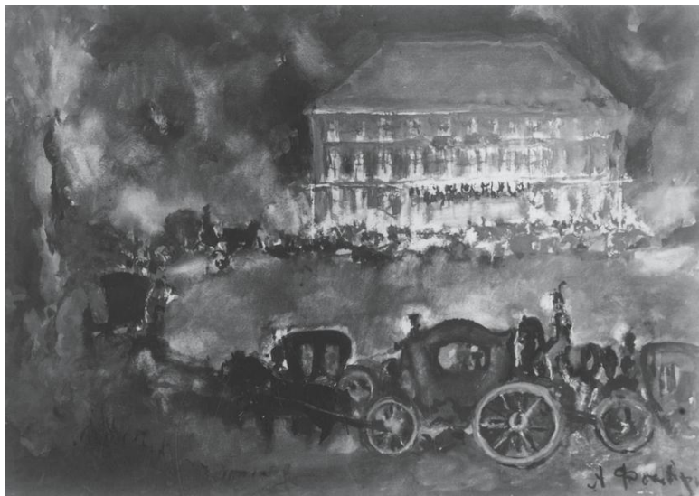
Театр Медокса (Петровский театр), предшественник Большого театра, около 1800 г.

История Большого театра идет рука об руку с историей страны – по крайней мере со времен русской революции, когда власть переместилась из Санкт-Петербурга в Москву. В царские времена Мариинский театр (позже известный как Ленинградский академический театр оперы и балета имени С. М. Кирова, а сокращенно – Кировский театр) обладал наибольшим престижем; Москва и ее балетный и оперный театр с сомнительным финансированием считались провинциальными. В зависимости от точки зрения, театр, город,