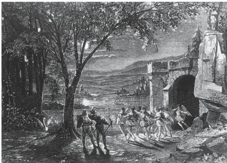
Иллюстрация появления маленьких лебедей к оригинальной постановке «Лебединого озера» 1877 года.