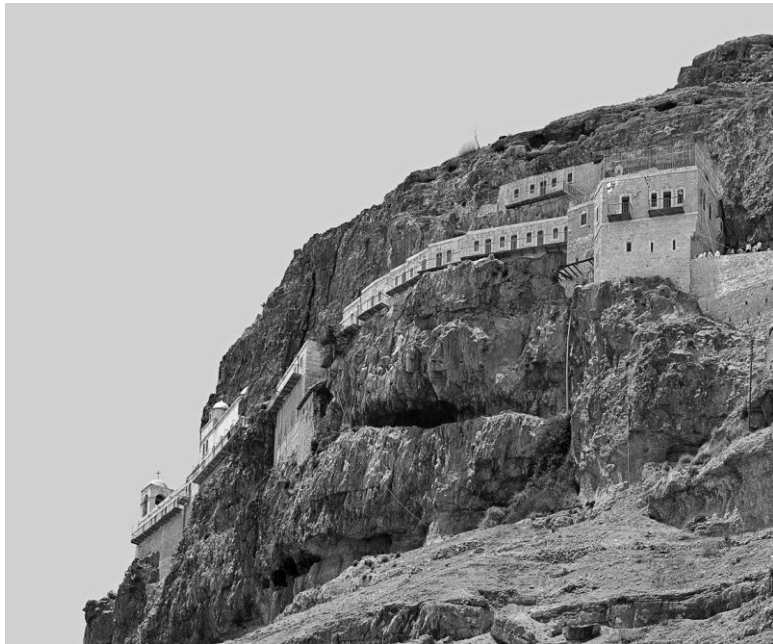
Гора Искушения.

Именно ее отождествляют с тем местом, где, согласно Евангелию, Спаситель держал пост и где Его искушал диавол.