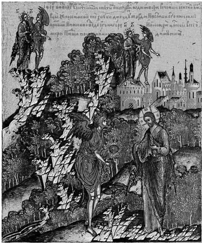
Искушение Христа. Клеймо иконы Спас Вседержитель. 1682. Симеон Холмогорец